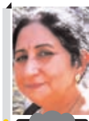
निर्मल रानी स्तंभकार

उसी समय सरकार को किसानों को ट्रैक्टर ट्रॉली सम्बन्धी नियमों की याद आती है। सोचने का विषय है जो किसान नेताओं के जुलूस रैलियों से लेकर चुनाव संपन्न करने तक व धर्मस्थलों से लेकर बड़े बड़े धार्मिक व राजनैतिक समागमों में अपने इस कृषि संसाधन का प्रयोग करने के लिये लोगों को उपलब्ध करता हो वही किसान अपने कृषि किसानों के अस्तित्व की रक्षा के लिये चलाये जाने वाले आंदोलनों में इसका प्रयोग क्यों नहीं कर सकता ? पिछले दिनों हरियाणा पंजाब की सीमा पर लगते शम्भू व खेनोरी बाँडर पर पंजाब से दिल्ली जाने वाले किसानों के काफिले को पुलिस द्वारा रोका गया। उस समय कुछ दुर्भाग्यपूर्ण घटनाएँ भी घटीं। इसी दौरान पुलिस की एक उच्चाधिकारी ओर से किसानों को सम्बन्धित एक वीडियो जारी कर यही कहा गया कि उच्च न्यायालय व उच्चतम न्यायालय के निर्देशानुसार पुलिस किसानों को ट्रैक्टर ट्रॉलियों का इस्तेमाल मुख्य मार्ग पर यातायात के साधन के रूप में नहीं करने देगी। इसका मतलब तो साफ है कि सरकार हर जगह तो ट्रैक्टर सम्बन्धी यातायात नियमों की अनदेखी कर सकती है परन्तु किसान आंदोलन में किसानों को वही कानून याद दिलाये जाते हैं ? 'ट्रैक्टर' नीति पर अपनाये जाने वाले इस दोहरे मापदंड का मतलब साफ है कि सरकार किसानों के इस संसाधन से डरती है और घबराती है ? शायद यही वजह है कि प्रशासन को सिर्फ किसान आंदोलन के समय ही ट्रैक्टर सम्बन्धी यातायात कानून आते हैं।