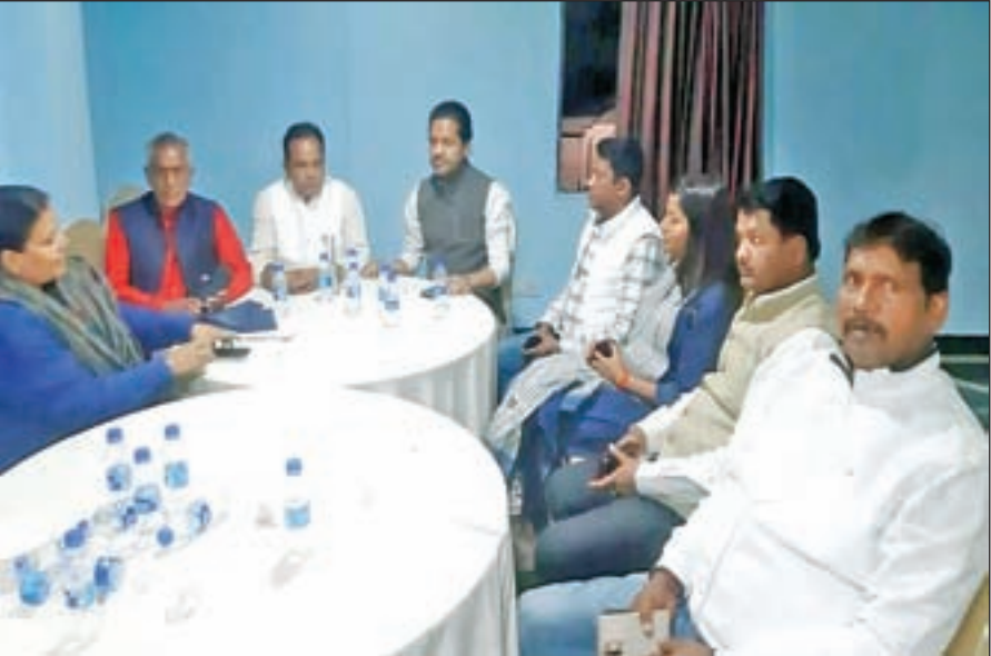
लोकतंत्र है जिसमें सभी को अपनी बात रखने का अधिकार है। उन्होंने कहा कि विधायक की नाराजगी दूर की जा रही है। हर विधायक चाहते हैं कि उनके क्षेत्र में अधिक से अधिक काम हो इसके लेकर

राष्ट्रीय खबर रांची: मंत्री पद को लेकर कांग्रेस में उठा विवाद समय के साथ थमने लगा है। दिल्ली दरबार में गुहार लगाने गए कांग्रेस के आधा दर्जन से अधिक विधायक खाली हाथ लौटने को मजबूर हो गए हैं। कांग्रेस अध्यक्ष मल्लिकार्जुन खड़गे से मुलाकात के बजाय उमंग सिंघार से मिलकर विधायकों ने बातों को रखा है। ऐसे में कांग्रेस के नाराज विधायक बुधवार तक रांची लौट आएंगे। 22 फरवरी को विधानसभा सत्र को लेकर होने वाली सत्तारूढ़ विधायक दल की बैठक में भाग लेंगे। 16 फरवरी को मंत्रिपरिषद विस्तार के समय से नाराज चल रहे कांग्रेस विधायक की स्थिति ना माया मिली ना राम जैसी है। पार्टी ने इतना ज़रूर किया है कि नाराज विधायक पर किसी तरह की अनुशासनात्मक कार्रवाई नहीं करने का फैसला लिया है। प्रदेश कांग्रेस अध्यक्ष राजेश ठाकुर का मानना है कि पार्टी के अंदर लोकतंत्र है जिसमें सभी को अपनी बात रखने का अधिकार है। उन्होंने कहा कि विधायक की नाराजगी दूर की जा रही है। हर विधायक चाहते हैं कि उनके क्षेत्र में अधिक से अधिक काम हो इसके लेकर