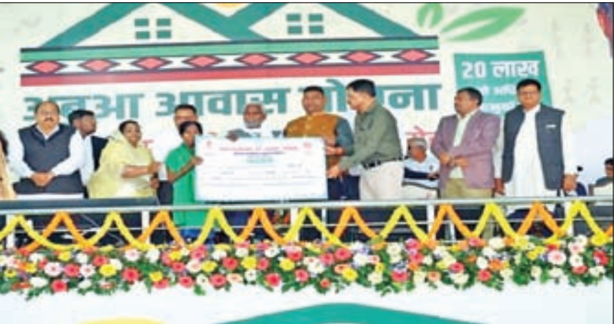
रहन-सहन को समझने का प्रयास किया है। हमारी हेमंत सोरेन की सोच और उनके द्वारा किए गए विकास कार्यों को आगे बढ़ाते हुए इन सभी वर्ग-समुदायों के आर्थिक, शैक्षणिक, सामाजिक व्यवस्था को मजबूत करने का पूरा प्रयास कर रही है। मुख्यमंत्री ने कहा कि झारखंड में शिक्षा व्यवस्था को सुदृढ़ करने को लेकर बेहतर कार्य किए गए हैं। पूर्व सीएम हेमंत सोरेन ने शिक्षा के क्षेत्र में बड़ा बदलाव लाने का कार्य कर दिखाया है। हमारी सरकार ने झारखंड के सरकारी स्कूलों में अध्येत विद्यार्थियों को छात्रवृत्ति राशि में तीन गुना तक वृद्धि की है, जबकि भाजपा की सरकार ने

राष्ट्रीय खबर रांची: मुख्यमंत्री चंपाई सोरेन ने गिरिडीह में अबुआ आवास योजना के लाभुकों के बीच स्वीकृति पत्र का वितरण किया। इस मौके पर सीएम ने कहा कि गिरिडीह, बोकारो और धनबाद जिले के 35 हजार से ज्यादा लाभार्थियों को अबुआ आवास योजना का लाभ मिल रहा है। सीएम ने घोषणा किया कि सरकार अगले तीन महीने में राज्य के 9 लाख परिवारों को अबुआ आवास योजना का लाभ देगी। इसकी तैयारी की जा रही है। कहा कि यह झारखंड वासियों के लिए विडंबना है कि यहां का कोयला देश को रोशन कर रहा है, लेकिन इन जिलों के ग्रामीण क्षेत्र में लोग आज भी कच्चे मकान या झुग्गी-झोपड़ी में रहने के लिए मजबूर हैं। पूर्व मुख्यमंत्री हेमंत सोरेन ने झारखंड के सभी वर्ग-समुदाय के बीच जाकर उनकी स्थिति और