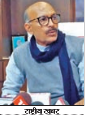
राष्ट्रीय खबर रांची: बजट सत्र को लेकर झारखंड विधानसभा में मंगलवार को राज्य सरकार के आला अधिकारियों के साथ विधानसभाध्यक्ष रवींद्रनाथ महतो ने हाईलेवल बैठक की। स्पीकर कक्ष में हुई इस बैठक में 23 फरवरी से 2 मार्च तक होनेवाले