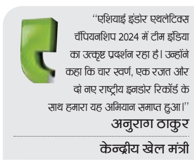
केन्द्रीय खेल मंत्री

iQOO Z9 5G में सेंट्रल पॉजिशन में पंच-होल के साथ AMOLED डिस्प्ले है। सिम्बोरिटी के लिए यह इन-स्क्रीन फिंगरप्रिंट स्कैनर से लैस है। फोन ने नीचे की ओर यूएसबी टाइप सी पोर्ट और एक स्पीकर नजर आता है। हालांकि, यह साफ नहीं साफ तौर पर नजर नहीं आ रहा है, एक सिम स्लॉट और एक माइक्रोफोन भी एक ही किनारे पर उपलब्ध हो सकता है। फोन के दाईं ओर वॉल्यूम रॉकर और पावर की है, जबकि बाईं ओर कुछ नहीं है। फोन लाइट ब्लू कलर के रियर पैन्ल में ब्रश हुए टेक्चर और एक स्क्वाअर कैमरा आईलैंड है। इसमें एक ड्यूल-कैमरा सेटअप और एक पिल शेप का एलईडी फ्लैश है। रियर की तरफ QOO ब्रांडिंग भी है। iQOO Z9 5G के अनुमानित स्पेसिफिकेशन CallMeShazzam के अनुसार, iQOO Z9 5G में AMOLED डिस्प्ले दी गई है जिसका FHD+ रेजॉल्यूशन, 120Hz रिफ्रेश रेट और 300Hz टच सैंपलिंग रेट प्रदान करता है। स्क्रीन का साइज 6 इंच से अधिक है।