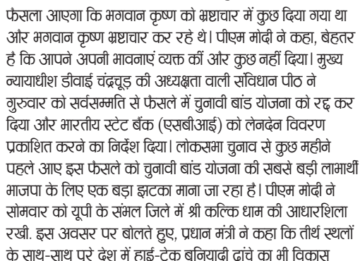
आचार्य विष्णु हरि राष्ट्रचित्तक