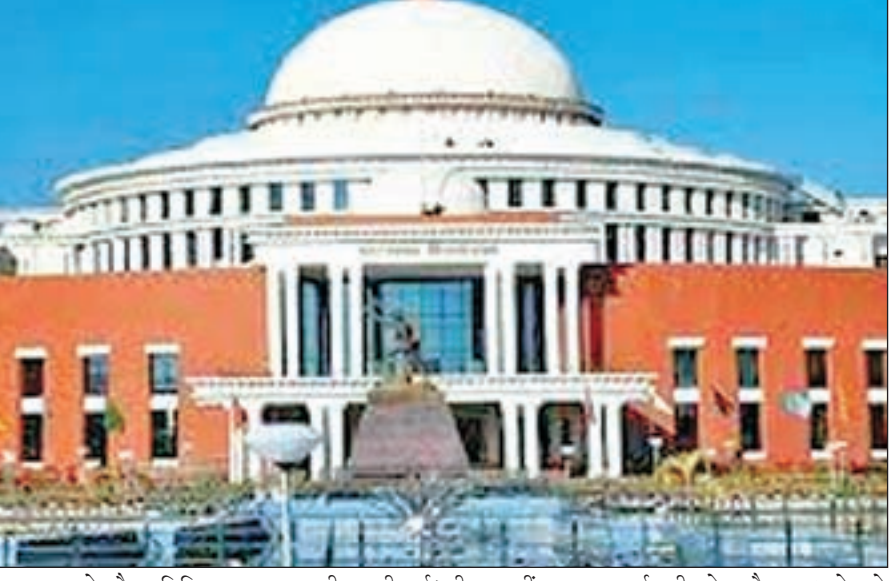
बजट सत्र के दौरान विधि व्यवस्था से लेकर प्रशासनिक तैयारी की समीक्षा की गई। स्पीकर रवींद्रनाथ महतो ने अधिकारियों को सदन की कार्यवाही के दौरान आनेवाले सवालों का ससमय, सही और

सटीक जवाब विभागों द्वारा दिए जाने का निर्देश दिया। विधानसभाध्यक्ष ने विभागीय सचिवों को निर्देश देते हुए कहा कि आज भी सदन के अंदर जाएं एक कड़ी सवाल का जवाब अनुत्तरित होने के कारण सदस्य संतुष्ट नहीं हैं, ऐसे में लंबित सभी सवालों का जवाब विधानसभा में उपलब्ध कराया जाए। मीडियाकर्मियों के द्वारा पूछे गए सवाल का जवाब देते हुए स्पीकर ने कहा कि सवालों का जवाब लंबित होने के पीछे की वजह यह है कि विभाग के अधिकारी विधानसभा के सवाल को गंभीरता से नहीं लेते हैं। ऐसे में उनको जिम्मेदारी समझनी होगी। बैठक में मुख्य सचिव एल खिचाने, डीजीपी अजय कुमार सिंह के