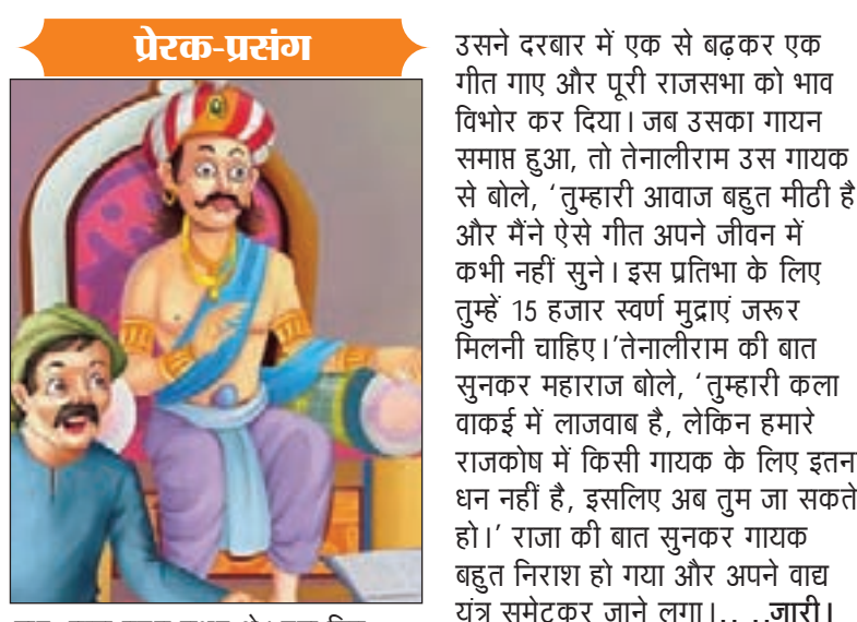
सुर-ताल बहुत मधुर थे। उस दिन