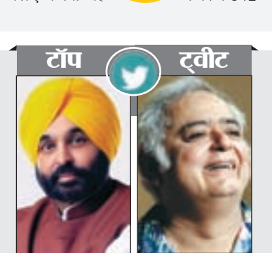
हंसल मेहता निदेशिक