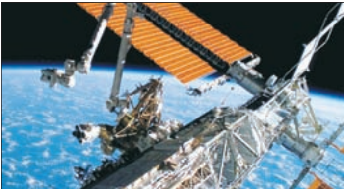
पावर डिमॉन्स्ट्रेटर (एसएसपीडी-1) को तीन तकनीकी नवाचारों को प्रदर्शित करने

रांची: अंतरिक्ष सौर ऊर्जा परियोजना सफलताओं और सबक के साथ पहले अंतरिक्ष मिशन को समाप्त कर चुकी है। एक साल पहले, कैलटेक के स्पेस सोलर