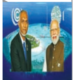
अधिकांश तकनीकी कर्मचारी हैं, जो मुख्य रूप से भारत द्वारा उपहार में दिए गए विमानों के रखरखाव में लगे हुए हैं। दुबई में मोदी जी, मुइज्जु ने घोषणा की कि भारत अपने सैनिकों को वापस बुलाने के लिए सहमत हो गया है, हालांकि नई दिल्ली ने अभी तक इस आश्वासन का कोई बयान नहीं दिया है।