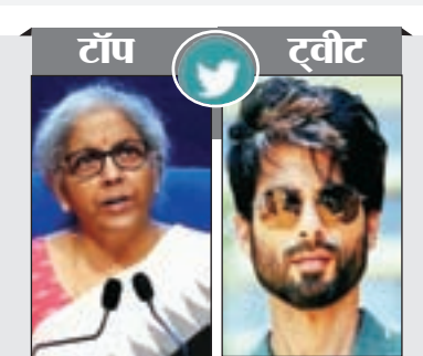
निर्मला सीतारमण वित्त मंत्री

“प्रायोगिकी का उपयोग किए बिना वित्तीय केंद्रों का इतनी तेजी से विस्तार नहीं होगा। भारत में खुदरा निवेशक हमारे शेयर बाजार को विकास में योगदान दे रहे हैं। स्थिर नीतियों और कभी सैकड़ों लोगों की मौत होती जाती थी और उन्हें दबाने के प्रयासों को सीमित सफलता ही हाथ लगती थी।