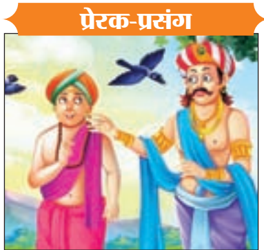
पड़ोसी को दोषी नहीं माना जा सकता है। राजा के साथ दरबार मौजूद सभी मंत्री और दरबारी भी तेनालीराम की इस बात को सुनकर हैरत में पड़ गए। राजा ने तेनालीराम से तुरंत पुछा, 'फिर तुम्हारे हिसाब से और कौन दीवार ढिरने के लिए अपराधी है।' इस पर तेनालीराम बोला, 'वो

हर दिन की तरह ही राजा कृष्णदेव राय अपने दरबार में बैठे हुए थे। तभी वहां एक चरवाहा अपनी फरियाद लेकर पहुंच गया। चरवाहे को देख राजा कृष्णदेव ने उसके दरबार में आने की वजह पूछी। तब चरवाहा बोला, हमहाराज मेरे साथ बड़ा गलत हुआ है। मेरे घर के करीब में रहने वाले आदमी के घर की दीवार ढह गई और उसके नीचे आने की वजह से मेरी बकरी मर गई। वहीं, जब मैंने उससे अपनी मरी हुई बकरी का हजाना मांगा, तो वह हजाना देने से मना कर रहा है। चरवाहे की बात पर महाराज कुछ बोलते उससे पहले ही तेनालीराम अपनी जगह से उठा और बोला, 'बेशक महाराज दीवार के गिरने के कारण बकरी मारी, लेकिन इसके लिए उस अकेले