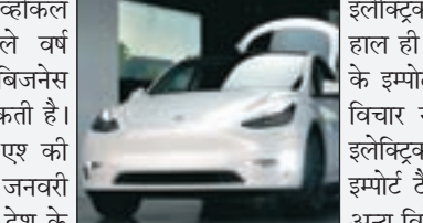
इलेक्ट्रिक व्हीकल्स के लिए काफी संभावना है। हाल ही में केंद्र सरकार ने बताया था कि देश में EV के इम्पोर्ट पर टैक्स में छूट देने के किसी प्रोजेक्ट पर विचार नहीं किया जा रहा। टेस्ला ने देश में अपनी इलेक्ट्रिक कारों की बिक्री शुरू करने के लिए सरकार से इम्पोर्ट टैक्स में छूट देने की मांग की थी। टेस्ला और अन्य विदेशी कार मेकरों को लोकल कंपोनेंट्स से वैल्यू एडिशन को लेकर और इम्पोर्ट टैक्स में सिम्बडी से जुड़े एक प्रश्न पर, मिनिस्टर ऑफ स्टेटे फॉर कॉमर्स एंड इंडस्ट्री Som Parkash ने कहा था कि ऑटोमोबाइल और ऑटो कंपोनेंट इंडस्ट्री के लिए सरकार ने 25,938 करोड़ रुपये के बजटीय आवंटन के साथ एक प्रोडक्शन-लिंक्ड इंसेंटिव स्कीम की घोषणा की थी। उनका कहना था कि इसका उद्देश्य EV सहित एडवांस्ड ऑटोमोटिव टेक्नोलॉजी वाले प्रोडक्ट्स की देश में मैनुफैक्चरिंग को बढ़ाना है। EV के इम्पोर्ट पर टैक्स में सिम्बडी देने का कोई प्रोजेक्ट नहीं है। टेस्ला ने सरकार से एए पर 40 प्रतिशत का इम्पोर्ट टैक्स लगाने का निवेदन किया था।

नई दिल्ली : अमेरिकी इलेक्ट्रिक व्हीकल (EV) मेकर Tesl अगले वर्ष जनवरी में भारत में अपना बिजनेस शुरू करने की घोषणा कर सकती है। देश में पिछले कुछ वर्षों में एए की बिक्री तेजी से बढ़ी है। गुजरात के गांधीनगर में जनवरी में होने वाले वाइब्रेंट गुजरात समिट में टेस्ला देश के एए मार्केट में एंटी की जानकारी दी सकती है। इस मौके पर कंपनी के फाउंडर Elon Musk के भी मौजूद होने की संभावना है। कुछ मीडिया रिपोर्ट्स में बताया गया है कि कंपनी की फैक्ट्री गुजरात के साणंद में लगाई जा सकती है। देश की सबसे बड़ी कार मेकर Maruti Suzuki और Tata Motors के भी साणंद में मैनुफैक्चरिंग प्लांट हैं। इन रिपोर्ट्स के अनुसार, वाइब्रेंट गुजरात समिट के दौरान टेस्ला अपनी फैक्ट्री के लिए एग्रीमेंट पर हस्ताक्षर कर सकती है। महाराष्ट्र, कर्नाटक और तमिलनाडु जैसे कुछ अन्य राज्य भी कंपनी को फैक्ट्री लगाने के लिए निमंत्रण दे रहे हैं। टेस्ला की इलेक्ट्रिक कारों की देश में बिक्री नहीं होती। इसका बड़ा कारण अधिक इम्पोर्ट ड्यूटी है। हालांकि, मस्क यह कह चुके हैं कि देश में