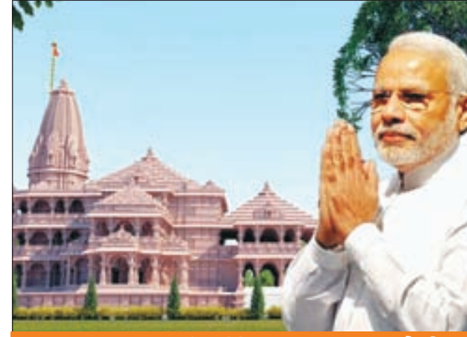
भगवान राम लला की मूर्ति का चयन मतदान से होगा

राष्ट्रीय खबर अयोध्या: बहुप्रतीक्षित राम मंदिर में रामलला की प्राण प्रतिष्ठा कार्यक्रम से पहले अयोध्या को विकास योजनाओं की सौगात देने शनिवार को रामनगरी पधार रहे प्रधानमंत्री नरेन्द्र मोदी का अभिनंदन यहां विभिन्न संस्कृतियों के समागम के साथ शंख और डमरु वादन से किया जायेगा। मुख्यमंत्री योगी आदित्यनाथ के निर्देश पर संस्कृति विभाग इस तैयारी में जुटा है। प्रधानमंत्री नरेन्द्र मोदी के आगमन पर शंख व डमरु वादन भी होगा। वहीं एयरपोर्ट से धर्मपथ, रामपथ होते हुए रेलवे स्टेशन तक कुल 40 मंचों पर लगभग 1400 से अधिक लोक कलाकार सांस्कृतिक कार्यक्रमों की प्रस्तुति देंगे। साथ ही एयरपोर्ट सभा स्थल पर भी 30 लोक कलाकारों की ओर से सांस्कृतिक कार्यक्रमों की सज्जारा बानगी। रास्ते में