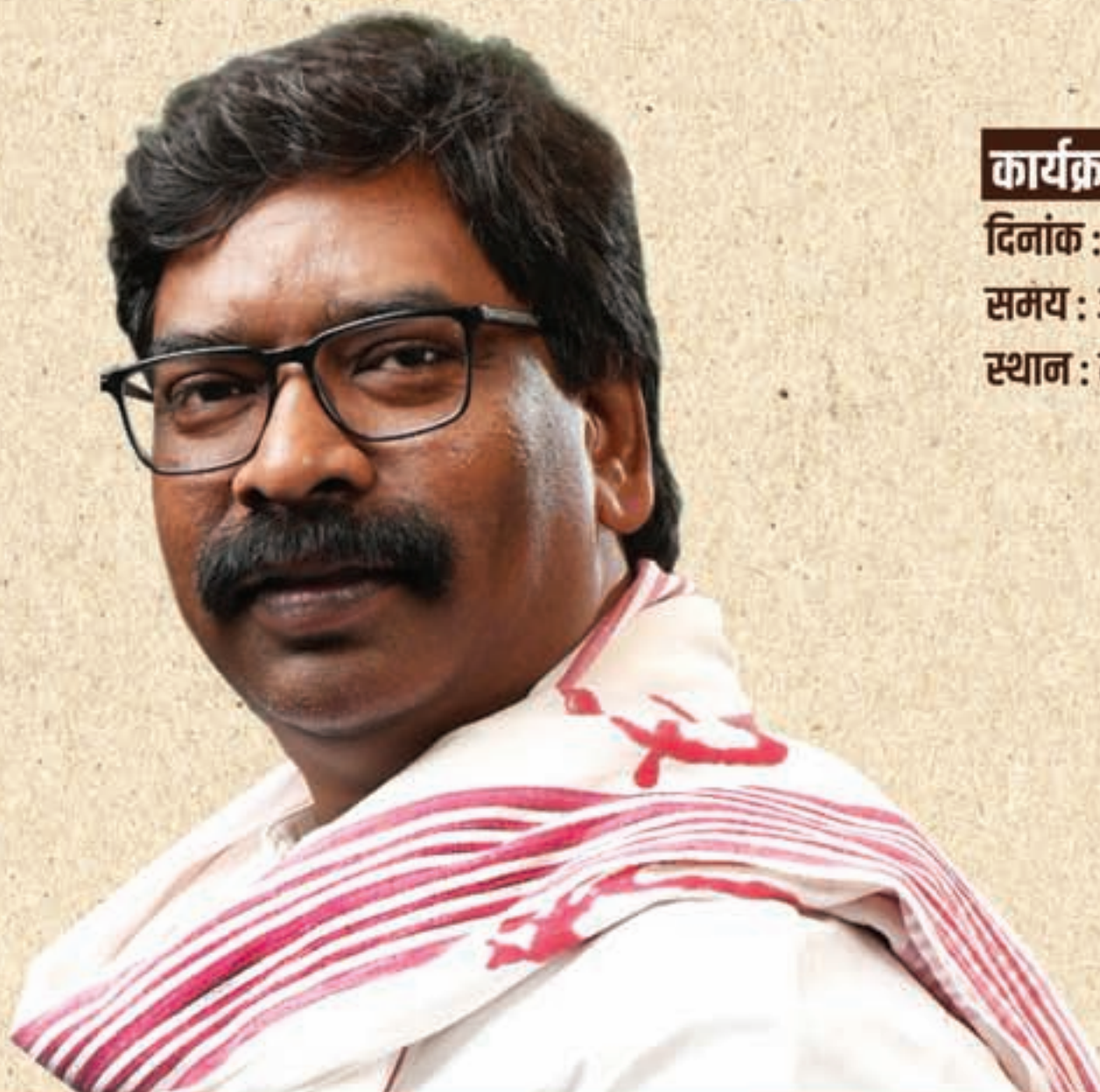
हेमन्त सोरेन मुख्यमंत्री, झारखण्ड