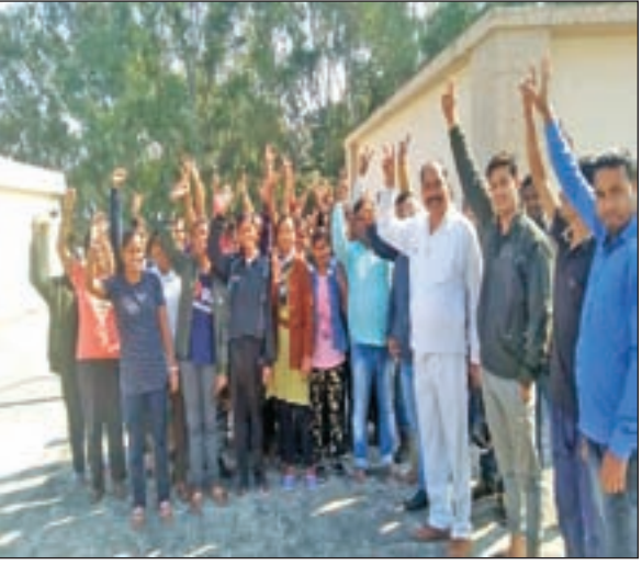
बताया कि पिछले 3 महीने से वेतन नहीं दिया गया है जबकि होमगार्ड के जवान रिम्स के