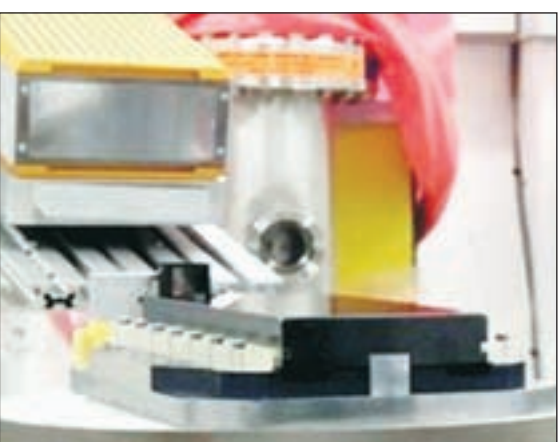
और माइक्रोमीटर रिजॉल्यूशन की नई विधि प्रस्तुत की है। एक्स-रे इमेजिंग जीवित कोशिकाओं और

रांची: एक्स रे नाम और काम से हम सभी परिचित है। खास तौर पर दुर्घटना में हड्डी टूटी है अथवा नहीं इसकी पहचान एक्स रे की जाती है, यह हम जानते हैं। हमें यह भी पता है कि इस काम के दौरान शरीर पर पड़ने वाली किरणें हानिकारक होती हैं। अब शोधकर्ताओं ने जीव विज्ञान और बायोमेडिसिन के लिए उच्च खुराक दक्षता