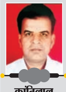
कार्थिकेयन मांडोत स्तंभकार