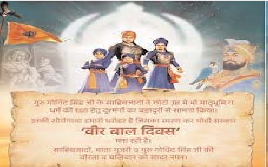
को कभी भुलाया नहीं जा सकता। उन्होंने कहा कि मुगल बादशाह औरंगजेब और उनके लोग के द्वारा तलवार के बल पर गुरु गोविंद सिंह के बच्चों का धर्म बदलना चाहते थे लेकिन उन्होंने अपने दो मासूम बच्चों के बलिदान का फैसला लिया और क्रोधित होकर औरंगजेब ने साहिबजादों को दीवार मे जिन्दा चिनवा दिया।गुरुद्वारे के