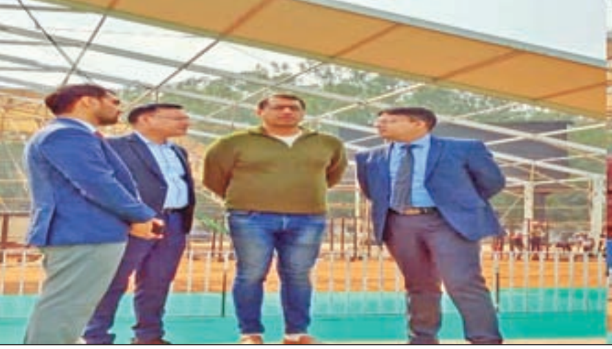
राज्य भर के लाभुक मोरहाबादी मैदान पहुंचे। इसीलिए मैदान के पीछे फुटबाल मैदान भी लोगों के बैठने की व्यवस्था की गई है।

रांची: हेमंत सरकार के चार साल पूरे होने और आपकी योजना, आपकी सरकार, आपके द्वार कार्यक्रम के समापन के मौके पर 29 दिसंबर को राजधानी के मोरहाबादी मैदान में भव्य कार्यक्रम का आयोजन किया जा रहा है। कार्यक्रम को लेकर तैयारियां जोर-शोर से हो रही हैं। कार्यक्रम की हो रही तैयारी का जायजा लेने मंगलवार को रांची के उपायुक्त राहुल कुमार सिन्हा मोरहाबादी मैदान पहुंचे। उन्होंने तैयारियों का निरीक्षण कर कई महत्वपूर्ण दिशा निर्देश भी दिए। तैयारियों का निरीक्षण करने के बाद रांची के उपायुक्त राहुल कुमार सिन्हा ने बताया कि 29 दिसंबर को होने वाले कार्यक्रम में