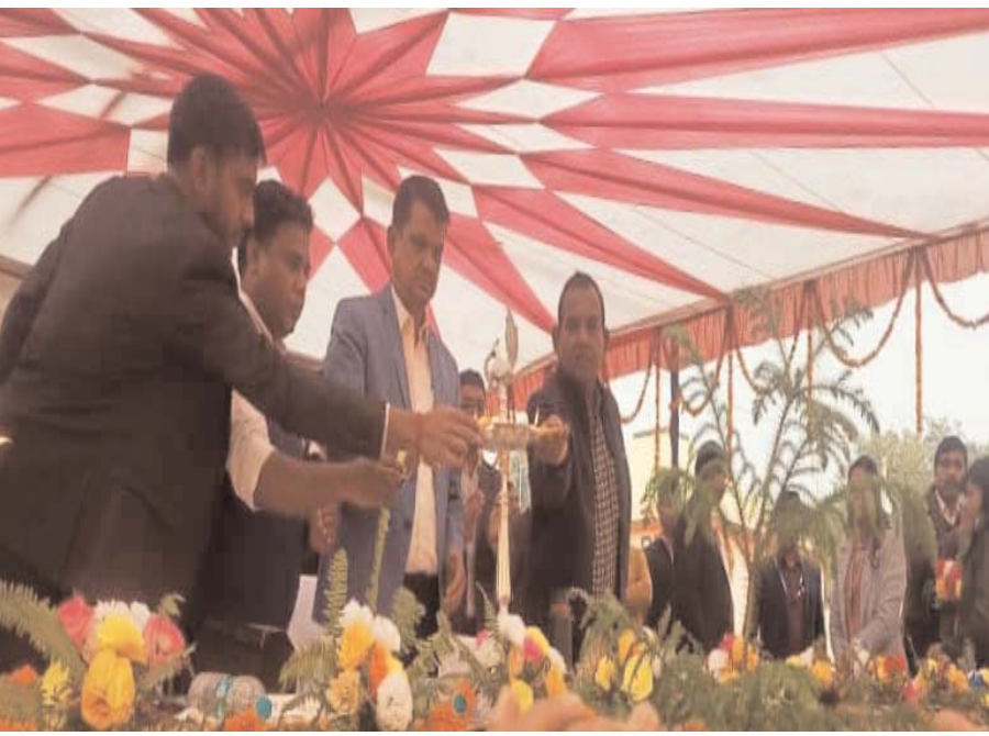
सांसद राजीव रंजन उर्फ ललन सिंह भी साथ में था। लेकिन शिलान्यास के बाद विपक्षी दलों के नेताओं के द्वारा कॉलेज के निर्माण पर संशय उठाने लगे। लेकिन जिले के तेजतरंग

राष्ट्रीय खबर मुंगेर : मेडिकल कॉलेज एवं अस्पताल निर्माण होने का रास्ता साफ हो गया है। मुंगेर में मेडिकल कॉलेज के निर्माण के लिए 30 किसानों ने जिला प्रशासन को सौंप दिया है। आज विधिवत 30 किसानों ने निबंधन कार्यलय में सतत लीज पर देने के लिए रजिस्ट्री कर दी है। इसके साथ ही मुंगेर में मेडिकल कॉलेज के निर्माण को लेकर राजनीतिक खींचतान एवं अटकलबाजियों का दौर समाप्त हो गया है। मुंगेर में 300 करोड़ रुपये की लागत से बननेवाली मेडिकल कॉलेज सह अस्पताल का मुख्यमंत्री नीतीश कुमार ने 25 नवंबर को मुंगेर जिले के जमालपुर प्रखंड के संदलपुर मौजा के मंगरा पोखर स्थित जमीन पर शिलान्यास किया। समारोह में उपमुख्यमंत्री तेजस्वी यादव के साथ मुंगेर के