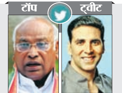
अक्षय कुमार बॉलीवुड अभिनेता

“मोदी सरकार ये नहीं चाहती कि सबक चले। लोकतंत्र में सबाल करना हमारा हक है। हम सबाल उठा रहे हैं कि संसद सुरक्षा में जो चूक हुई, उस पर अंडरसी रिसर्चर्स, शिमाओ वंडरलैंड इंटरकांटेनेटल जैसी शानदार जगहों पर हनीमून के लिए जा सकते हैं।”