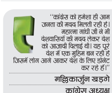
मल्लिकार्जुन खड्गे कांग्रेस अध्यक्ष

तो यह 1.6 इंच के डिस्प्ले के साथ आती है। डायल सर्कुलर दिया गया है। इसमें नॉटिफिकेशन के लिए कंपनी ने एक बड़ा क्राउन बटन दिया है। वॉच में ब्ल्यूटूथ की कनेक्टिविटी है। यह इनबिल्ट माइक्रोफोन और स्पीकर से लैस है। इसमें ब्ल्यूटूथ कॉलिंग और वॉयस असिस्टेंट फंक्शन भी है। स्मार्टवॉच में कंपनी ने कई कलर कॉम्बिनेशन दिए हैं जिससे कि इसका लुक काफी आकर्षक लगता है। स्मार्टवॉच कई तरह से हेल्थ मॉनिटर भी करती है। इसमें हेल्थ फीचर्स जैसे हार्ट रेट मॉनिटरिंग, स्लीप ट्रैकिंग, SpO2 लेवल आदि दिए हैं। इसमें 100 से ज्यादा स्पॉट्स मोड दिए गए हैं। साथ ही स्मार्ट नोटिफिकेशंस, वेदर अपडेट, कैल्कुलेटर, म्यूजिक, कैमरा कंट्रोल जैसे देरों फीचर्स हैं। बैटरी लाइफ की बात करें तो इसमें 600mAh की बैटरी है, यह 8 दिन का बैटरी बैकअप दे सकती है। यह क्लासिक मोड की बैटरी लाइफ बताई गई है। ब्ल्यूटूथ कॉलिंग के साथ यह 5 दिन तक चल सकती है। वहीं स्टैंडबाय टाइम 25 दिन का बताया गया है।