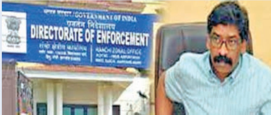
है या फिर जांच में सहयोग के लिए। इसके साथ ही सीएम ने