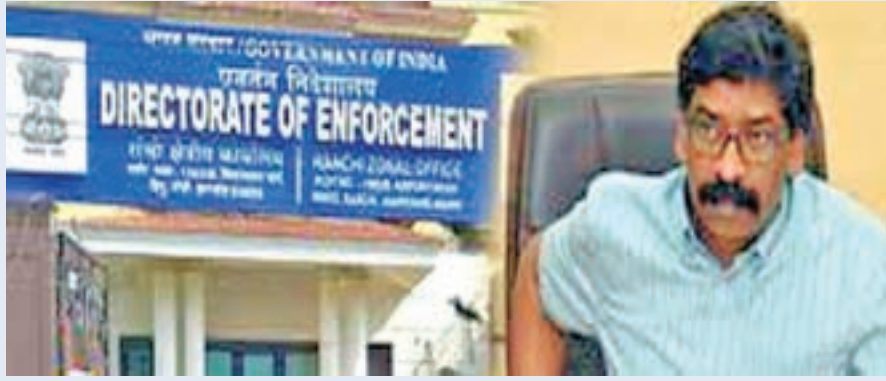
है या फिर जांच में सहयोग के लिए। इसके साथ ही सीएम ने