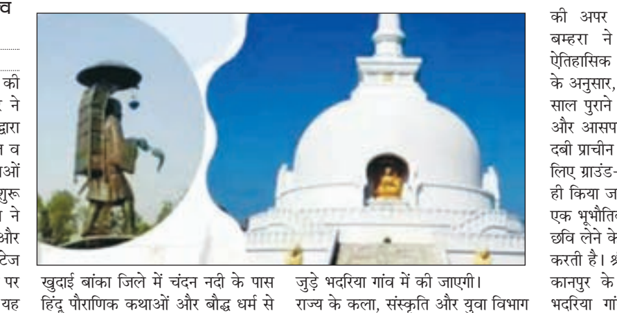
खुदाई बांका जिले में चंदन नदी के पास जुड़े भदरिया गांव में की जाएगी। हिंदू पौराणिक कथाओं और बौद्ध धर्म से राज्य के कला, संस्कृति और युवा विभाग

दिनाजपुर के साथ साथ पूर्णिया, अररिया जिले के रेल यात्री उठा सकते। रेलवे की जारी नोटिस के मुताबिक, पटना के लिए यह ट्रेन न्यू जलपाईगुड़ी से सुबह 6 बजे चलेगी, जो किशनगंज और कटिहार में ठहराव के बाद दोपहर 1 बजे पटना पहुंच जाएगी। ऐसे में एनजेपी से पटना तक के सफर में महज 7 घंटे लगे। वहीं, पटना की ओर जाने वाली यह ट्रेन किशनगंज में सुबह 7 बजे तो कटिहार में सुबह साढ़े 8 बजे पहुंचेगी। फिर, वापसी में पटना से यह दोपहर 3 बजे चलेगी, जो कटिहार शाम साढ़े 7 बजे तो किशनगंज रात 8.50 पर पहुंचेगी और अपने गंतव्य एनजेपी रात 10 बजे पहुंचेगी।