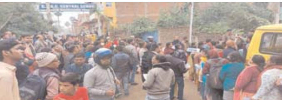
कारण 2:30 बजे परीक्षा शुरू हुई। परीक्षा समाप्त के पश्चात परीक्षार्थियों द्वारा बताया गया कि विज्ञान के कुछ