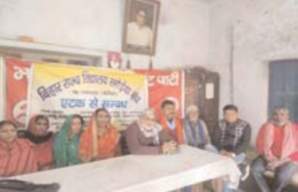
तो है ही सबसे बड़ी बात यह है कि मध्याह्न भोजन को एनजीओ के जिम्मे सौंपना सर्वोच्च न्यायालय के आदेश एव. गाईड लाईन का खुल्लम खुल्ला उलंघन है, क्योंकि सर्वोच्च न्यायालय बच्चों को ताजा