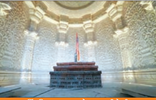
मूर्ति प्रतिष्ठा अनुष्ठान 16 से 22 जनवरी के बीच

अतिथियों और श्रद्धालुओं का इंतजाम जारी यहां पर ढेर सारे तंबू शहर बनाये जा रहे हैं गागा मठ के वंशज करेंगे मुख्य पूजन समारोह