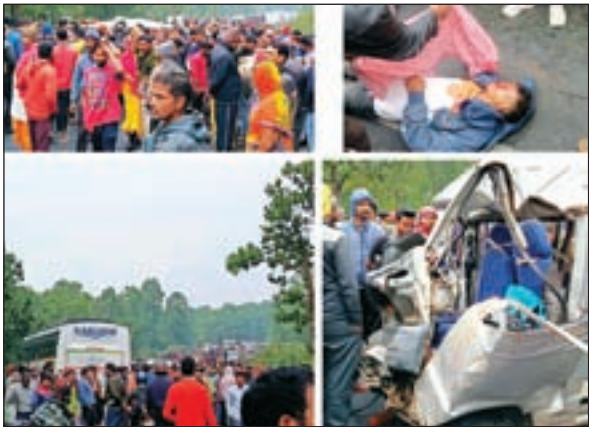
करीब 9 की है। प्राप्त जानकारी के मुताबिक मारुति वैन स्कूली

हजारीबाग : हजारीबाग जिले के कटकमसांडी थाना क्षेत्र कटकमसांडी छात्र मार्ग पर जमुनिया सोती के पास स्कूली मारुति वैन एवं यात्री बस के बीच आमने-सामने की टक्कर हुई घटना शुक्रवार की सुबह