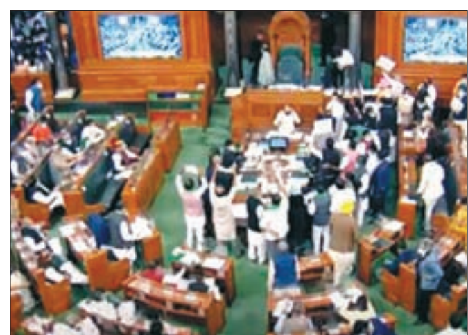
तृणमूल कांग्रेस की सांसद महुआ मोड़ना की सदस्यता रद्द