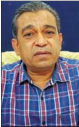
एजेंसियां उदयपुर : कृषोन्नति योजना के कृषि विस्तार पर उप मिशन आत्मा योजना अन्तर्गत वर्ष 2023-24 में