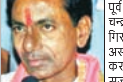
हैदराबाद: तेलंगना के पूर्व मुख्यमंत्री के चंद्रशेखर राव को गिरने के बाद अस्पताल में भर्ती कराया गया है।

सकती है। डॉक्टरों को संदेह है कि के. चंद्रशेखर राव को गिरने के बाद कूल्हे में फ्रैक्चर हुआ होगा और उन्हें अस्पताल में भर्ती कराया गया है।