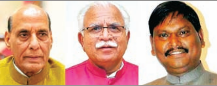
नयी दिल्ली: भारतीय जनता पार्टी (भाजपा) ने राजस्थान, मध्य प्रदेश और छत्तीसगढ़ में