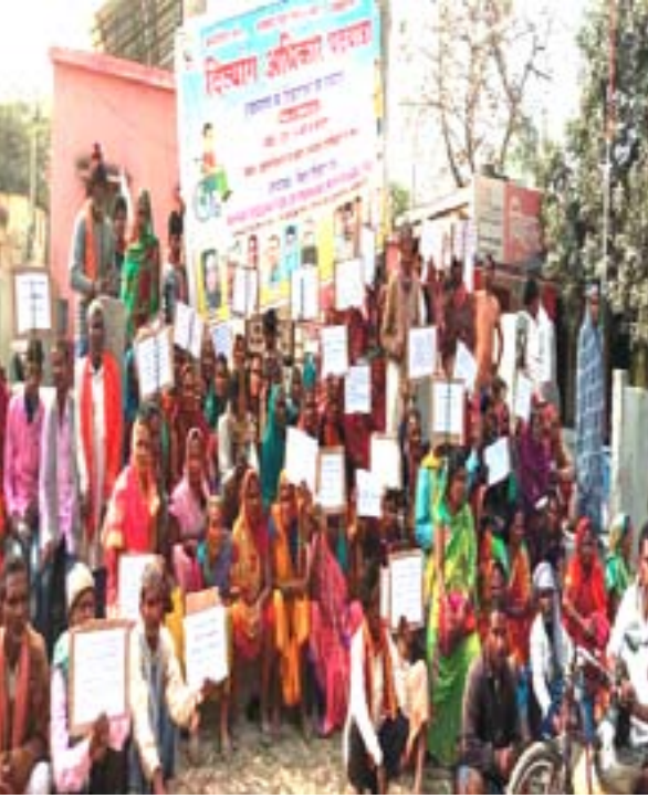
कराया जाए। दिव्यांगजन अधिकार अधिनियम 2016 को लागू करने सहित 35 मांगों से संबंधित एक जापन बगहा एसडीएम को दिया।