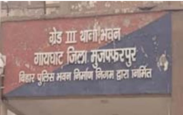
न्यायिक हिरासत में भेज दिया है। बता दें कि 6 दिन पहले मुजफ्फरपुर के गावघाट थाना क्षेत्र से एक खेत में दफनाए गए एक व्यक्ति की लाश