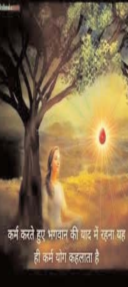
कर्म करते हुए भगवान की पाद में रत्ना यह ही कर्म योग कहलाता है