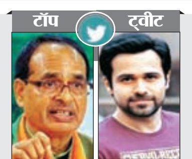
हमराज हाशमी बाँलिवुड अभिनेता

‘द डर्टी पिक्चर फिल्म मेरे दिल के बेहद करीब है। मैं जब महसूस करता हूँ कि इस फिल्म का मैं हिस्सा बना। 2011 में ‘द डर्टी पिक्चर’ जैसी फिल्म बनाना एक साहसी डिसिजन था। इस फिल्म की कहानी अपनो समय से बहुत आगे थी।’