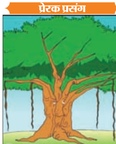
गांववालों को आरी-कुल्हाड़ी लाते देख, बरगद के पास खड़ा एक वृक्ष

कि सी गांव में बरगद का एक पेड़ बहुत वर्षों से खड़ा था। गांव के सभी लोग उसकी छाया में बैठते थे, गांव की महिलाएँ त्यौहारों पर उस वृक्ष की पूजा किया करती थीं। ऐसे ही समय बीतता गया। और कई वर्षों बाद वृक्ष सूखने लगा। उसकी शाखाएँ टूटकर गिरने लगीं और उसकी जड़ें भी अब कमजोर हो चुकी थीं। गांववालों ने विचार किया कि अब इस पेड़ को काट दिया जाये और इसकी लकड़ियों से गृहविहीन लोगों के लिए झोपड़ियों का निर्माण किया जाये।