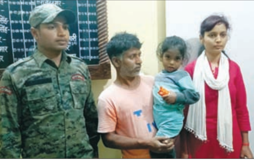
जमालपुर पुलिस की कार्य कुशलता का हो रहा प्रसंशा