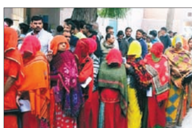
आज रेगिस्तानी राज्य के लोगों के लिए महत्वपूर्ण क्षण है

भाजपा सभी सीटों पर चुनाव लड़ रही एक सीट का चुनाव स्थगित हुआ है दोनों तरफ से गारंटी की दावेदारी