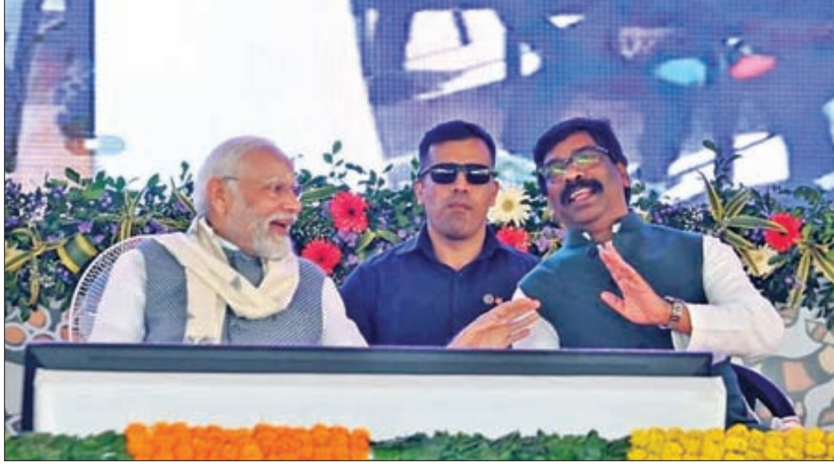
► मुझे आदिवासी होने पर गर्व: सीएम

► भगवान बिरसा मुंडा की धरती पर प्रधानमंत्री का स्वागत: अर्जुन मुंडा