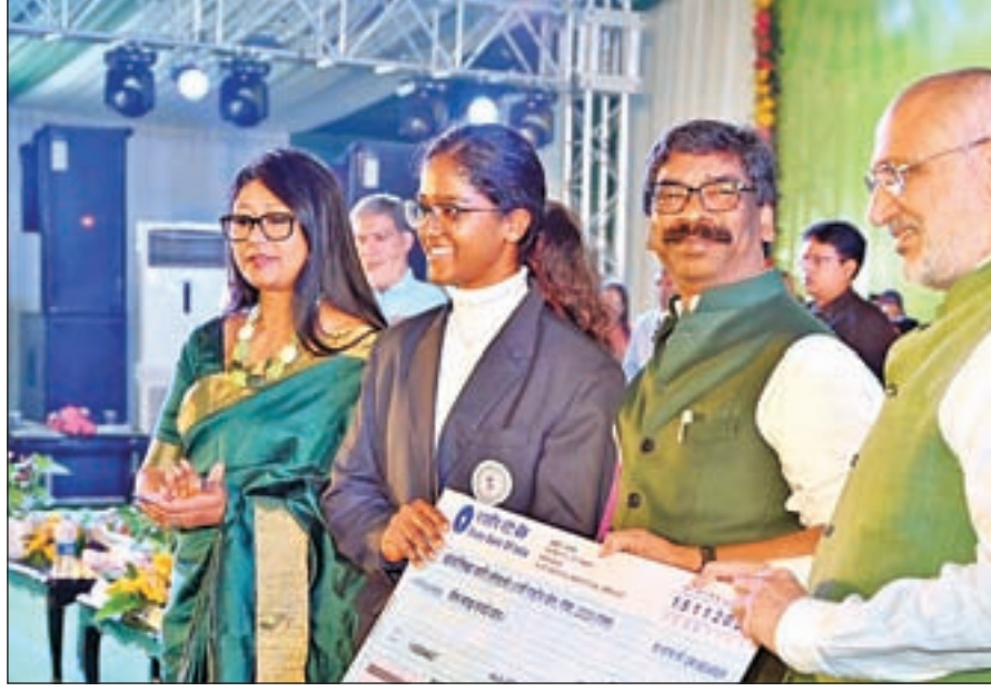
निर्माण विभाग के 44, पथ निर्माण विभाग के 35 और उद्योग विभाग

देकर उनके हौसले और करियर को उड़ान दी। लगभग 260 करोड़ रुपये की परिसंपत्ति बांटकर लाभुकों को सशक्त और स्वावलंबी बनाने की राह दिखाई तो खिलाड़ियों को पुरस्कृत कर उनकी उपलब्धियों को सम्मान दिया। मुख्यमंत्री ने इस अवसर पर 7042 करोड़ रुपये की 896 योजनाओं की सौगात दी। इसमें 1714 करोड़ रुपये की राशि से 229 योजनाओं का उद्घाटन और 5328 करोड़ रुपये की 677 योजनाओं का शिलान्यास शामिल है। जिन योजनाओं का उद्घाटन हुआ, उसमें ऊर्जा की 3, जल संसाधन विभाग के 7, नगर विकास एवं आवास विभाग के 3, ग्रामीण कार्य विभाग के 72, ग्रामीण विकास विभाग के 22, पेयजल एवं स्वच्छता विभाग के 37, भवन