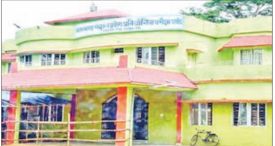
झारखंड में बीएड के कुल 133 कॉलेज हैं, जिसमें से 4 सरकारी

रांची: झारखंड में चौथे राउंड की बीएड की काउंसिलिंग पूरी हो चुकी है, इसके बाद भी 3000 सीटें खाली हैं। आगे क्या करना है इसके लिए झारखंड संयुक्त प्रदेश प्रतियोगिता परीक्षा पर्यट (जेसीईसीईबी) ने झारखंड उच्च एवं तकनीकी शिक्षा विभाग को पत्र भेजा है। वहीं उच्च एवं तकनीकी शिक्षा विभाग से मिली जानकारी के अनुसार इस पर काम चल रहा है। आगे काउंसिलिंग किया जाएगा या फिर ओपन काउंसिलिंग किया जाएगा। इसके लिए नोटिफिकेशन बहुत जल्द जारी कर दिया जाएगा।