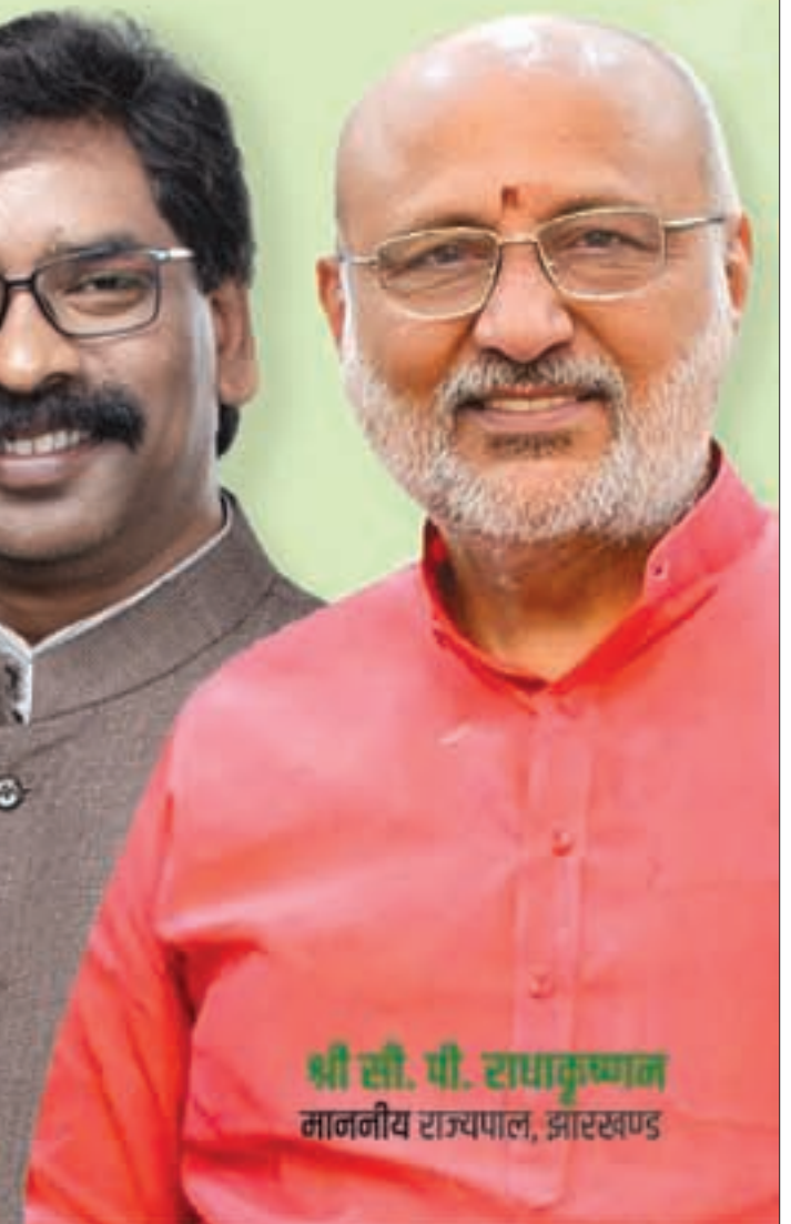
श्री सी. पी. रामचन्द्रगन माननीय राज्यपाल, झारखण्ड