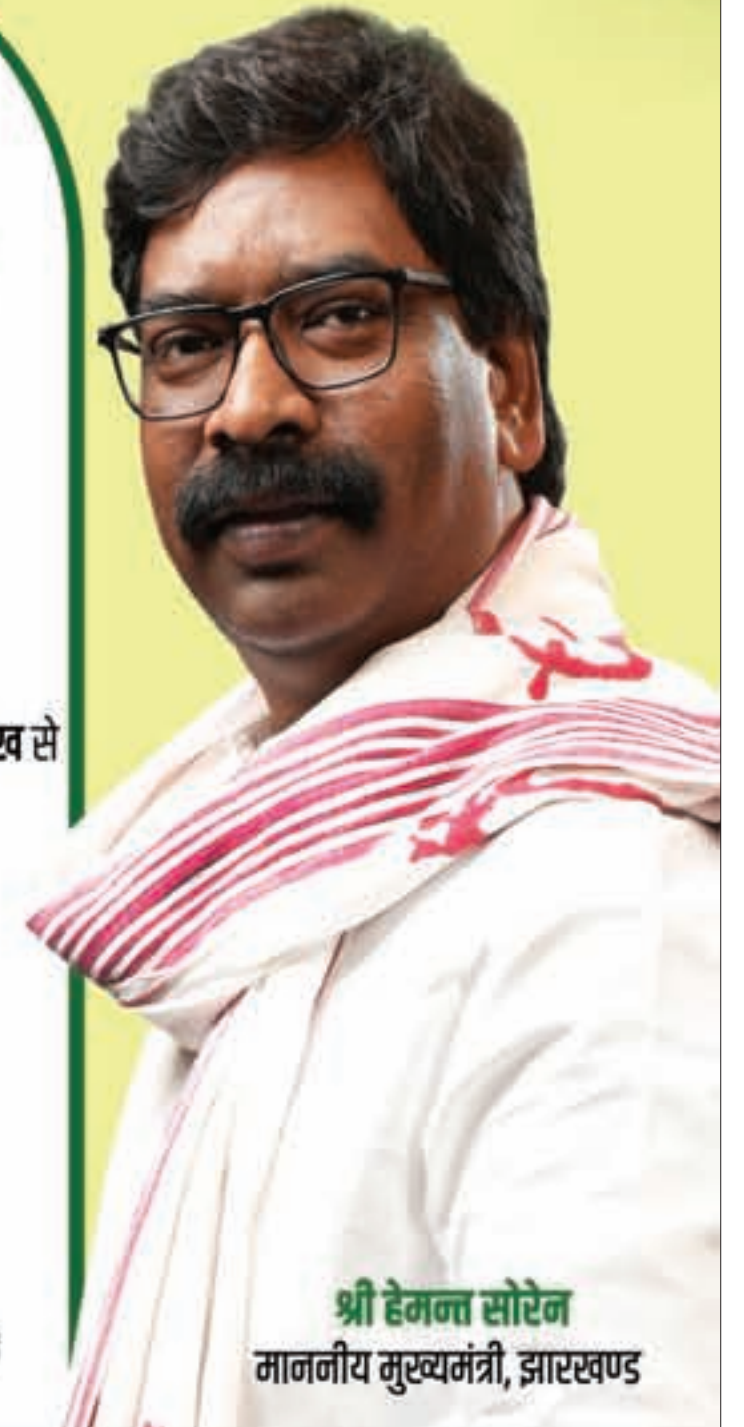
श्री हेमन्त सोरेन माननीय मुख्यमंत्री, झारखण्ड