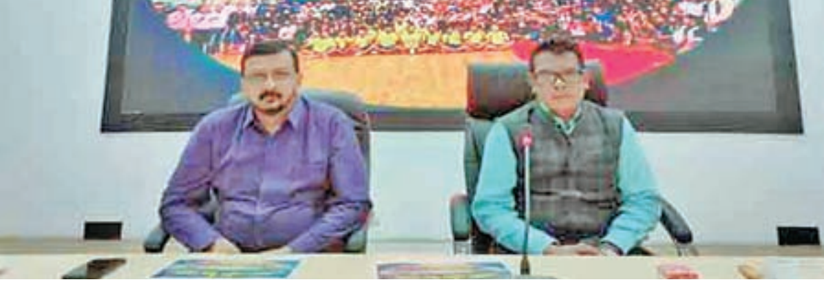
रांची में आयोजित छह खेलों की संभावित तिथि 19 से 22 दिसंबर 2023 फुटबॉल, 26 से 29 दिसंबर 2023 खो- खो, 04 से 07 जनवरी 2024 कबड्डी, 17 से 21 जनवरी 2024 वूशु 01 से 04 फरवरी 2024 स्केटिंग, 08 से 12 फरवरी 2024 साइक्लिंग