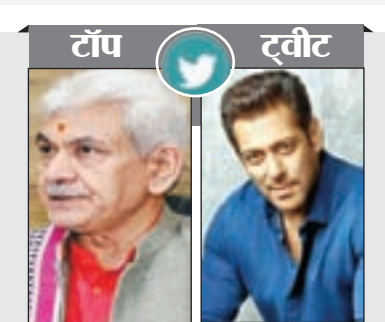
मनोज सिन्हा जम्मू-कश्मीर के उप राज्यपाल

“ अपनी संव्य प्रतिभा और वैतिक बल का प्रदर्शन करके, शिवाजी ने लाखों भारतीयों को एकजुट किया और कर्नाट साम्राज्य के लिए संप्रभुता हासिल की। उनके सार्वजनिक और शाश्वत नृत्य आज भी प्रसिद्ध हैं और सामाजिक उन्नतता और शांतिपूर्ण सह-अस्तित्व के मार्ग पर हमारा मार्गदर्शन कर रहे हैं।”