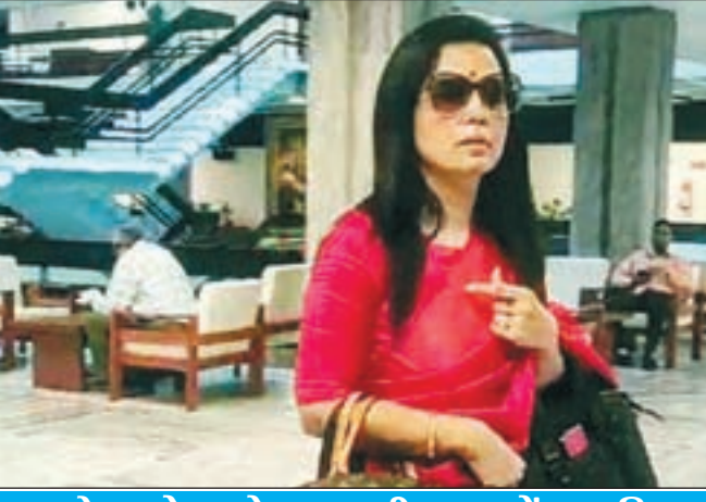
मोइत्रा ने अपने शुरुआती बयान में कहा कि

कोई सांसद खुद सवाल तैयार नहीं करता लॉग इन के नियमों पर सवाल उठाये गये विपक्ष ने कहा राष्ट्रीय सुरक्षा का मुद्दा नहीं