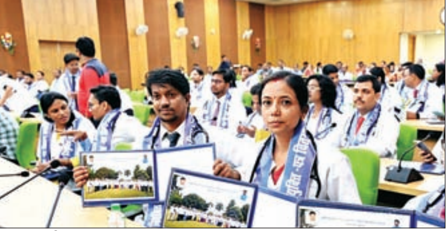
राष्ट्रीय ख़बर रांची: मुख्यमंत्री हेमंत सोरेन ने कृषि पशुपालन एवं सहकारिता विभाग द्वारा आयोजित नियुक्ति पत्र वितरण समारोह में नवनियुक्त 66 पशु चिकित्सकों को नियुक्ति पत्र

सौंपा। कहा कि झारखंड में लगातार नियुक्तियां हो रही हैं। युवाओं को रोजगार के अवसर उपलब्ध कराए जा रहे हैं। झारखंड गठन के वक्त जो कार्य होना चाहिए था, वे आज उन कार्यों को कर रहे हैं। पूर्व की सरकारों पर निशाना साधते हुए कहा कि जब से उनकी सरकार बनी है, तब से उनकी प्राथमिकता में युवा हैं। उन्हें रोजगार देने में सरकार जुटी हुई है। पिछले दिनों पलामू में आयोजित प्रमंडल स्तरीय रोजगार मेले में बड़ी संख्या में युवाओं के बीच ऑफर