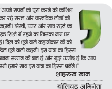
“अपने सपनों को पूरा करने की कोशिश कर रहे सरल और वास्तविक लोगों की कहानी। दोस्ती, प्यार और साथ रहने का एक रिश्ते में रहने का जिसका नाम घर है। दिल को छूने वाले कहानीकार की की दिल छूने वाली कहानी। इस यात्रा का हिस्सा बनना सम्मान की बात है और मुझे उन्मील है कि आप उसी हमारे साथ इस यात्रा का हिस्सा बनते हैं।”