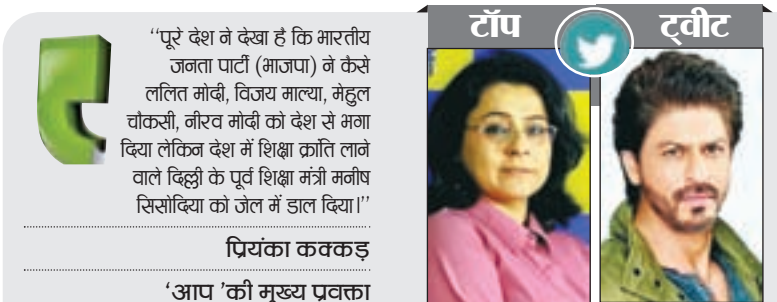
“पूरे देश में देखा है कि भारतीय जनता पार्टी (भाजपा) ने कैसे ललित मोदी, विजय गाल्या, मेहुल चोकसी, नीलव मेहोडा को देश से भगा दिया। लोकप्रिय देश में शिक्षा क्रांति लाने वाले दिल्ली के पूर्व शिक्षा मंत्री मनीष सिंसाधिया को जेल में डाल दिया।”

लगता है कि नई सीरीज जल्द लॉन्च होने वाली है। चीनी सोशल मीडिया प्लेटफॉर्म वीबो पर ही टिप्सटर डिजिटल चैट स्टेशन ने भी अपकमिंग वनप्लस डिवाइस से जुड़ी इन्फर्मेशन शेयर की है। बताया है कि OnePlus 12 के बेस मॉडल में 12 जीबी रैम और 256 जीबी इंटरनल स्टोरेज होगा। कुछ रिपोर्टों में यह भी कहा गया है कि कंपनी चीन में नवंबर महीने में OnePlus 12 सीरीज को लॉन्च कर देगी। बीते हफ्ते इस फोन का चीनी वेरिएंट मॉडल नंबर PJD110 के साथ AnTuTu बेंचमार्क डाटाबेस पर नजर आया था। हाल में एक नया OnePlus फोन, मॉडल नंबर CPH2581 और Snapdragon 8 Gen 3 चिपसेट के साथ गौकबैच पर नजर आया। ऐसा लगता है कि यह OnePlus 12 का ग्लोबल वर्जन है।