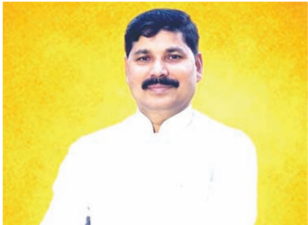
আমাবাণী ১২ নভেম্বর শিখ দলের বৈঠকে হুচড়া সিদ্ধান্ত, বিদ্যুৎককে সমর্থন করার আহ্বান