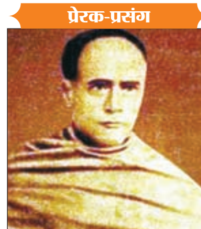
प्रेरक-प्रसंग लिए सोने के कंगन बनवाकर ले गए और उन्होंने माँ से कहा- माँ! आज मैंने बचपन का तुम्हारा कर्ज उतार दिया। उनकी माँ ने कहा- हबबेटी! मेरा

श्वरचंद्र विद्यासागर के बचपन की यह एक सच्ची घटना है। एक सवेरे उनके घर के द्वार पर एक भिखारी आया। उसको हाथ फैलाये देख उनके मन में करुणा उमड़ी। वे तुरंत घर के अंदर गए और उन्होंने अपनी माँ से कहा कि वे उस भिखारी को कुछ दे दें। माँ के पास उस समय कुछ भी नहीं था सिवाय उनके कंगन के। उन्होंने अपना कंगन उतारकर ईश्वरचंद्र विद्यासागर के हाथ में रख दिया और कहा- जिस दिन तुम बड़े हो जाओगे, उस दिन मेरे लिए दूसरा बनवा देना अभी इसे बेचकर जरूरतमंदों की सहायता कर दो। बड़े होने पर ईश्वरचंद्र विद्यासागर ने अपनी पहली कमाई से अपनी माँ के