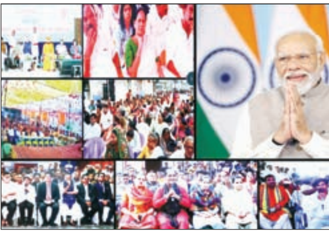
नवनियुक्त भर्तियों को 51,000 से अधिक नियुक्ति पत्र वितरित किया

नयी दिल्ली: प्रधानमंत्री नरेन्द्र मोदी ने गुरुवार को वीडियो कांफ्रेंसिंग के माध्यम से विकसित भारत संकल्प यात्रा में शामिल सरकार की विभिन्न योजनाओं के लाभार्थियों के साथ बातचीत की और प्रधानमंत्री महिला किसान ड्रोन केंद्र का भी उद्घाटन किया। प्रधानमंत्री ने एम्स देवघर में खोले गए ऐतिहासिक 10,000वें जन औषधि केंद्र का भी लोकार्पण किया। इसके अलावा उन्होंने देश में जन औषधि केंद्रों की संख्या 10,000 से बढ़ाकर 25,000 करने के कार्यक्रम भी शुभारंभ किया। प्रधानमंत्री ने स्वतंत्रता दिवस पर अपने भाषण में महिला स्वयं सहायता समूहों को ड्रोन प्रदान करने और जन औषधि केंद्रों की संख्या 10,000 से बढ़ाकर