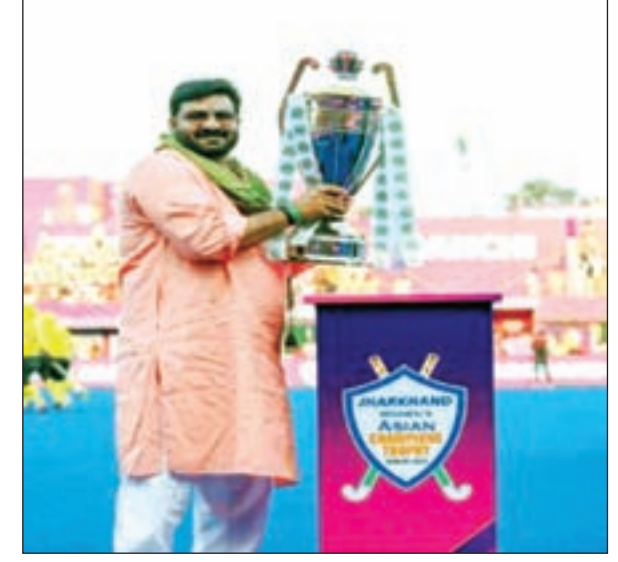
परिसर में मौजूद हैं। मैदान के स्टिक के साथ कट आउट भी बाहर सीएम हेमंत सोरेन का हॉकी देखते बन रहा।