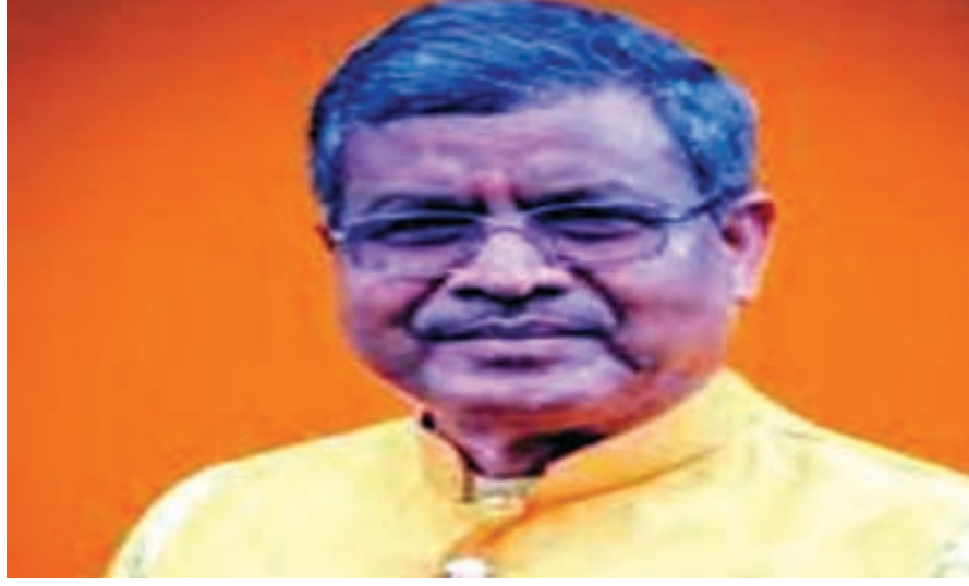
को समझकर उनकी सुरक्षा करनी चाहिए। उन्होंने कहा कि झारखंड पुलिस घटना में संलिप्त दोषियों

रांची:पूर्व सीएम और भाजपा के प्रदेश अध्यक्ष बाबूलाल मरांडी ने दुमका के हंसडीहा मॉब लिंगिंग की घटना को लेकर हेमंत सरकार पर हमला किया है। बाबूलाल ने ट्वीट कर कहा कि मुख्यमंत्री हेमंत सोरेन झूठ बोलने की आदत से मजबूर हैं। कहते हैं कि उनके शासन में प्रदेश में मॉब लिंगिंग की एक भी घटना नहीं हुई है, जबकि उनके जिले में ही आदिवासी युवक की सर्राह हत्या कर दी गयी है। कहा कि हेमंत सोरेन सिर्फ अपने घोटालों को छिपाने के लिए आदिवासी समाज को ढाल बना रहे हैं, जबकि उन्हें अपनी जिम्मेदारियों