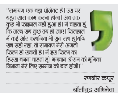
रामायण एक बड़ा प्रोजेक्ट है। उस पर बहुत सारा काम करना होगा। अब तक कुछ भी फाइनल नहीं हुआ है। मैं चाहता हूँ कि जल्द सब कुछ तय हो जाए। फिलहाल मैं कई और कहानियों की तैयारी कर रहा हूँ। यह सब सही रहा, तो रामायण की अगली फिल्म हो सकती है। मैं इस फिल्म का हिस्सा बनना चाहता हूँ। महाबल श्रीराम की गूँकवा निमाता मेरे लिए सम्मान की बात होगी।।