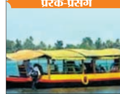
प्रेरक-प्रसंग नौका, मैं नहीं जाने वाला। वह अपनी किताब कापियों एक हाथ में ऊपर उठा लेता है और छपाक नदी में कूद जाता है। नाविक देखता ही रह गया। मुख से निकला- अजीब मनमौजी लड़का है। छप-छप करते नवयुवक गंगा नदी पार कर जाता है। रामनगर के तट पर अपनी किताबें रखकर कपड़े निचोड़ता है। भींगे

ना व गंगा के इस पार खड़ी है। यात्रियों से लगभग भर चुकी है। रामनगर के लिए खुलने ही वाली है, बस एक-दो सवारी चाहिए। उसी की बगल में एक नवयुवक खड़ा है। नाविक उसे पहचानता है। बोलता है - 'आ जाओ, खड़े क्यों हो, क्या रामनगर नहीं जाना है?' नवयुवक ने कहा, 'जाना है, लेकिन आज मैं तुम्हारी राव से नहीं जा सकता।' क्यों भैया, राव तो इसी नाव से आते-जाते हो, आज क्या बात हो गयी? आज मेरे पास उतराई देने के लिए पैसे नहीं हैं। तुम जाओ। अरे! यह भी कोई बात हुई। आज नहीं, तो कल दे देना। नवयुवक ने सोचा, बड़ी मुश्किल से तो मैं भी उतराई का खर्च जुटाती हूँ। कल भी यदि पैसे का प्रबन्ध नहीं हुआ, तो कहाँ से दूंगा? उसने नाविक से कहा, तुम ले जाओ