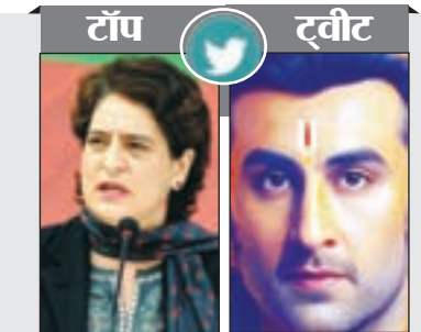
रणबीर कपूर बॉलीवुड अभिनेता