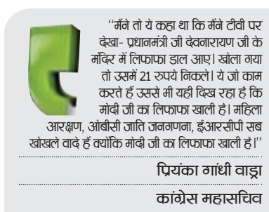
पियंका गांधी वाड़ा कांग्रेस महासचिव