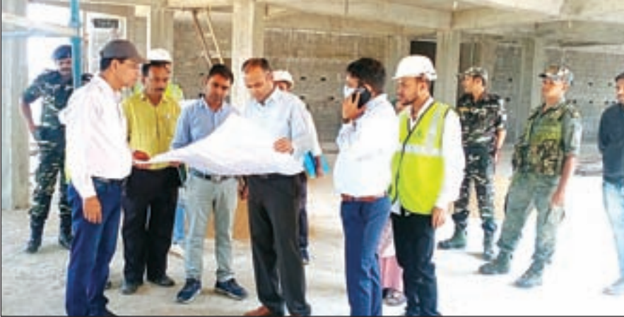
उपायुक्त ने कुछ कमरों के निर्माण में आवश्यकता अनुसार बदलाव भी करने के निर्देश दिए वहीं प्रत्येक फ्लोर में बनाए गए कमरों में कौनसे विभाग का कार्यालय बनाया जाएगा उससे संबंधित भी चर्चा हुई। उपायुक्त ने इस दौरान भवन

गुमला: उपायुक्त कर्ण सत्याथी ने चंदाली स्थित निमार्णाधीन नए समाहरणालय भवन का निरीक्षण किया। इस दौरान उपायुक्त ने भवन निर्माण में उपयोग किए जाने वाले सामग्रियों की गुणवत्ता जांच की वहीं उन्होंने समाहरणालय भवन के डिजाइन को भी देखा। उन्होंने स्वयं सभी कमरों का निरीक्षण करते हुए आवश्यक बदलाव एवं त्रुटियों में सुधार करने हेतु आवश्यक दिशा निर्देश दिए। इस दौरान उपायुक्त ने कुछ कमरों के निर्माण में आवश्यकता अनुसार बदलाव भी करने के निर्देश दिए वहीं प्रत्येक फ्लोर में बनाए गए कमरों में कौनसे विभाग का कार्यालय बनाया जाएगा उससे संबंधित भी चर्चा हुई। उपायुक्त ने इस दौरान भवन