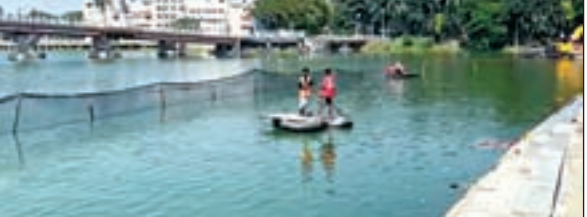
रांची: विसर्जन जुलूस को लेकर रांची के सभी प्रमुख नदी, तालाब और डैम के साथ-साथ राज्य के

दूसरे नदी तालाबों में सुरक्षा के पुख्ता इंतजाम किये गये हैं। शहर के सभी तालाबों में दंडाधिकारियों की प्रतिनियुक्ति की गयी है। रांची नगर निगम क्षेत्र में चार स्थलों पर प्रतिमा का विसर्जन किया जाता है। इसमें सबसे महत्वपूर्ण बड़ा तालाब है। बड़ा तालाब में इस बार सुरक्षा के बेहद उठना इंतजाम किए गए हैं। एनडीआरएफ की टीम को तो तैनात किया ही गया है साथ स्थानीय गोताखोरों को भी काम पर लगाया गया है। बड़ा तालाब सहित सभी नदी और डैम में लाल निशान बना कर उसे जाली से घेर दिया गया है। मूर्ति विसर्जन करने वालों को खतरे के निशान से आगे बढ़ने की मनाही रहेगी।