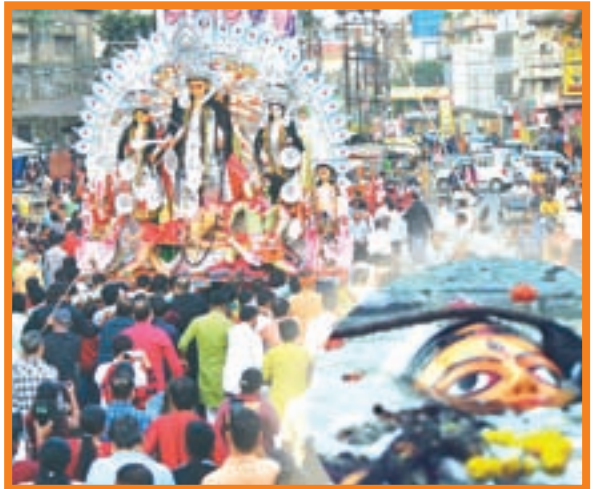
दुर्गावाटी की पारंपरिक दुर्गा प्रतिमा का विसर्जन धूमधाम से किया गया। इसकी विशेषता यह है कि पुरानी परंपरा के मुताबिक श्रद्धालु कंधे पर लेकर प्रतिमा का विसर्जन करते हैं।