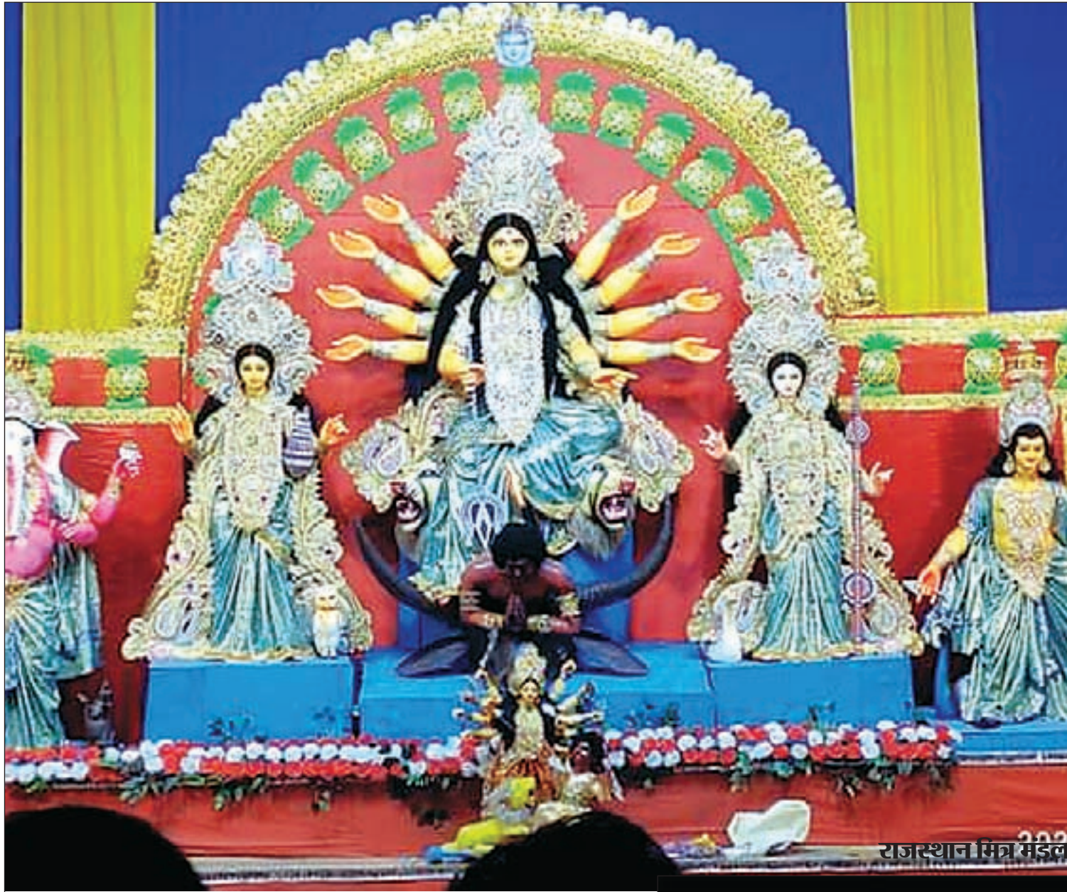
राजस्थान मित्र मंडल