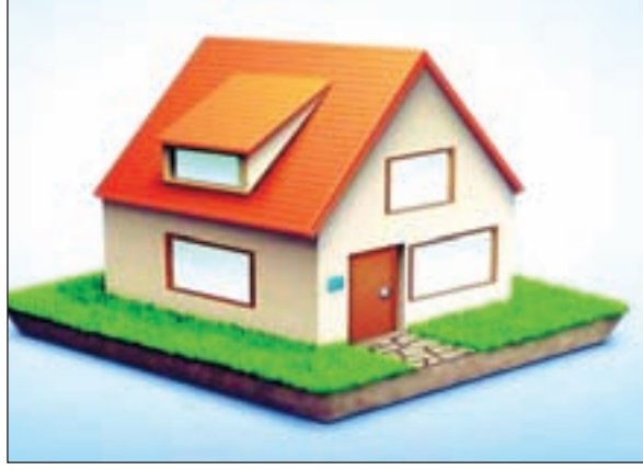
आधारित होगी। आठ अंक लाने वाले लाभुकों को आवास देने में सर्वोच्च प्राथमिकता दी जायेगी। लाभुकों का रैंक भी जारी होगा।

रांची: झारखंड के ग्रामीण क्षेत्रों के गरीब गृहविहिन लोगों को पक्का घर उपलब्ध कराने के लिए राज्य संपोषित योजना अबुआ आवास योजना की स्वीकृति मिल गयी है। ग्रामीण विकास विभाग ने इस आशय का संकल्प भी जारी कर दिया है। राज्य में 16300 करोड़ रुपये खर्च किए जायेंगे। आठ लाख लाभुकों के लिए आवास योजना स्वीकृत होगी। इन आवासों को तीन वित्तीय वर्ष में बनाया जायेगा। आवास पाने के लिए लाभुकों की पात्रता अंक