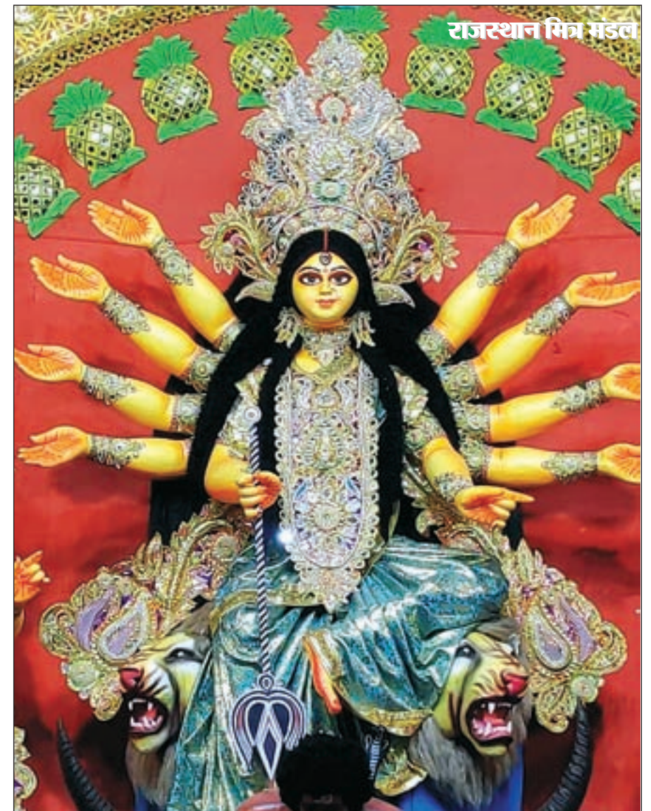
राजस्थान मित्र मंडल