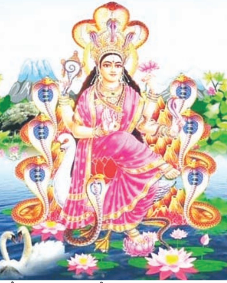
নাগের দেবী মা মনসা