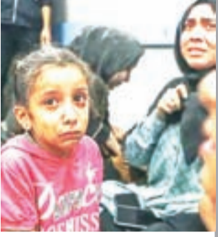
আল আহলি হাসপাতালে হামলার পরে গাজার গির্জা পরিচালিত একমাত্র হাসপাতালটিতে বিস্ফোরিত হয়েছে।