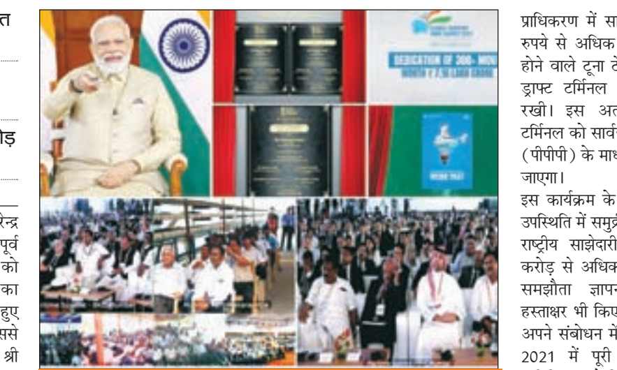
ऐतिहासिक कॉरिडोर भी क्षेत्रीय और वैश्विक व्यापार की तस्वीर बदल देगा

समुद्री परिवहन की लागत कम करने की सोच 23 हजार करोड़ की परियोजनाओं की शुरुआत समारोह में सात लाख करोड़ के निवेश का करार