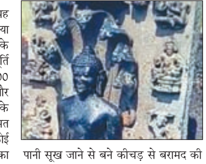
पानी सूख जाने से बने कीचड़ से बरामद की

पार्श्वनाथ की मूर्ति पुरुलिया से प्राप्त हुई। यह अति प्राचीन मूर्ति सोमवार की सुबह पुरुलिया दो नंबर ब्लॉक के गोलामारा ग्राम पंचायत के बरुआडी गांव से बरामद की गयी। यह मूर्ति 9वीं से 10वीं शताब्दी की है। लगभग 1,200 वर्ष पूर्व। लोक संस्कृति शोधकर्ताओं और पुरातत्व पर काम करने वाले लोगों के मुताबिक अंतरराष्ट्रीय बाजार में इसकी कीमत 100 करोड़ से भी ज्यादा हो जाए तो कोई आश्चर्य नहीं होगा। प्रतिमा बरुआडी जोड़ का