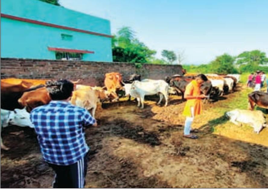
बाज नहीं आ रहे हैं। एरिया बदल-बदलकर वो पशु तस्करी में लगे हुए हैं। पिछले दिनों ही

रांची: राजधानी में पुलिस ने पशु तस्करो के खिलाफ कार्रवाई की है। पुलिस ने 53 मवेशी लदे तीन पिकअप वैन को जब्त किया है। दो लोगों को भी पकड़ा गया है। यह कार्रवाई कांके थाना क्षेत्र में की गई है। बताना कि कांके थाना क्षेत्र के हुसिर गांव में पुलिस ने ग्रामीणों की सूचना पर कार्रवाई की। जिसमें पुलिस ने 53 मवेशी जब्त किए, जो तीन पिकअप वैन में लदे थे। पुलिस ने मामले में दो लोगों को हिरासत में भी लिया है। हिरासत में लिए गए लोगों से पूछताछ की जा रही है। इसके अलावा जब्त मवेशियों को सुरक्षित स्थान भेजने की तैयारी की जा रही है। गौरतलब है कि पुलिस की लगातार कार्रवाई के बाद भी पशु तस्करो, तस्करी से