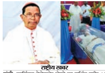
रांची: कार्डिनल तेल्लेफोर टोपो का पार्थिव शरीर 11 अक्टूबर को संत मरिया महागिरजा घर में दफनाया