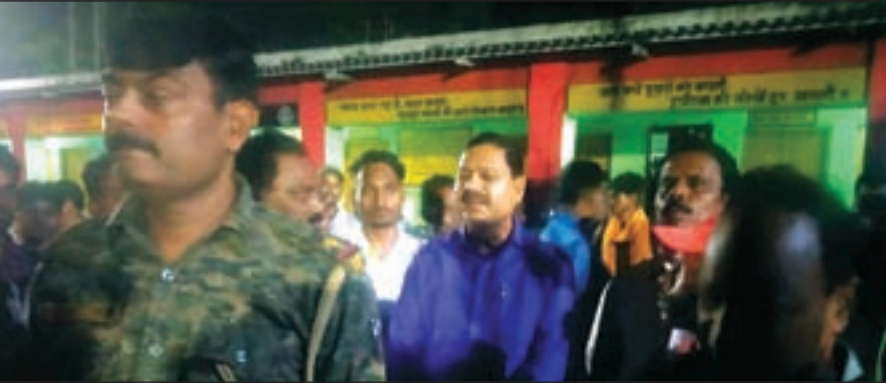
परिजनों ने मुआवजा की मांग को लेकर शव रख धरने पर बैठे