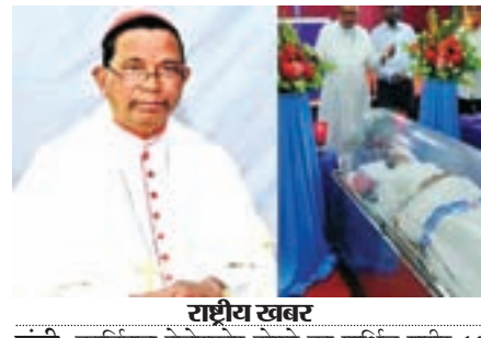
रांची: कार्डिनल तेल्लेफोर टोपो का पार्थिव शरीर 11 अक्टूबर को संत मरिया महागिरजा घर में दफनाया जाएगा।