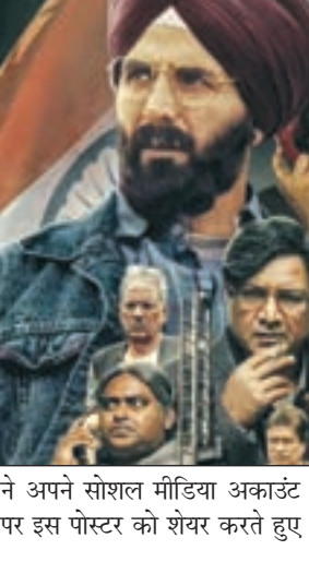
ने अपने सोशल मीडिया अकाउंट पर इस पोस्टर को शेयर करते हुए

एजेंसियां मुंबई: बॉलीवुड के जानेमाने अभिनेता अक्षय कुमार की आने वाली फिल्म मिशन रानीगंज का नया पोस्टर रिलीज हो गया है। अक्षय कुमार की फिल्म मिशन रानीगंज मार्शलिंग इंजीनियर जसवंत सिंह गिल के जीवन से प्रेरित है। गिल ने 1989 में रानीगंज कोलफोल्ड्स में 64 लोगों को बचाया था। फिल्म में अक्षय कुनमार जसवंत सिंह का किरदार करते नजर आएंगे। फिल्म मिशन रानीगंज का नया पोस्टर रिलीज हो गया है, जो सभी के बीच देशभक्ति की भावना पैदा करेगा। निर्माताओं