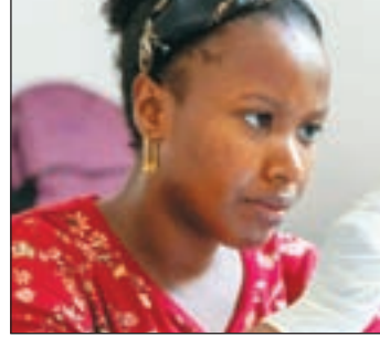
मलेरिया के खिलाफ प्रभावी टीके कहीं अधिक परिकृत है क्योंकि यह मानव शरीर के अंदर लगातार आकार

सिफारिश की गई है जिसका बड़े पैमाने पर उत्पादन किया जा सकता है। यह टीका ऑक्सफोर्ड विश्वविद्यालय द्वारा विकसित किया गया है और यह विकसित होने वाला केवल दूसरा मलेरिया टीका है। मलेरिया से ज्यादातर शिशुओं और शिशुओं की मौत होती है और यह मानवता पर सबसे बड़े संकटों में से एक है। इस वैक्सिन के प्रति वर्ष 100 मिलियन से अधिक खुराक बनाने के लिए पहले से ही समझौते मौजूद हैं।