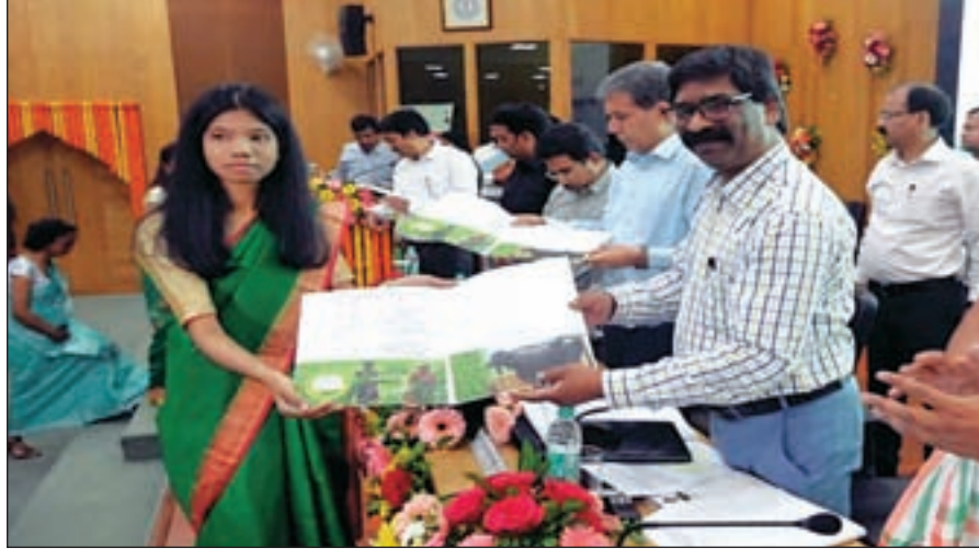
अभ्यर्थियों को समय पर प्रोजेक्ट भवन पहुंचना है। सहायक अभियंता (असेिनिक-यांत्रिक) सीधी भर्ती प्रतियोगिता परीक्षा के लिए विज्ञापन संख्या 8-2018

राष्ट्रीय खबर रांची: गांधी जयंती के अगले दिन यानी 3 अक्टूबर 2023 को अलग-अलग कैटेगरी में राज्य के 47 सहायक अभियंताओं को नियुक्ति पत्र मिलेगा। चयनित अभियंताओं का रोल नंबर भी जारी कर दिया गया है। नगर विकास एवं आवास विभाग की ओर से बताया गया है कि असेिनिक कोटि के 32 सहायक अभियंता, यांत्रिक कोटि ने 09 सहायक अभियंता और विद्युत कोटि के 06 सहायक अभियंताओं का सीधी भर्ती प्रतियोगिता परीक्षा के तहत चयन हुआ है। नियुक्ति पत्र खुद मुख्यमंत्री हेमन्त सोरेन सौंपेंगे। इसके लिए 3 अक्टूबर 2023 को प्रोजेक्ट भवन के द्वितीय तल स्थित सभागार में कार्यक्रम का आयोजन होगा। लिहाजा, चयनित