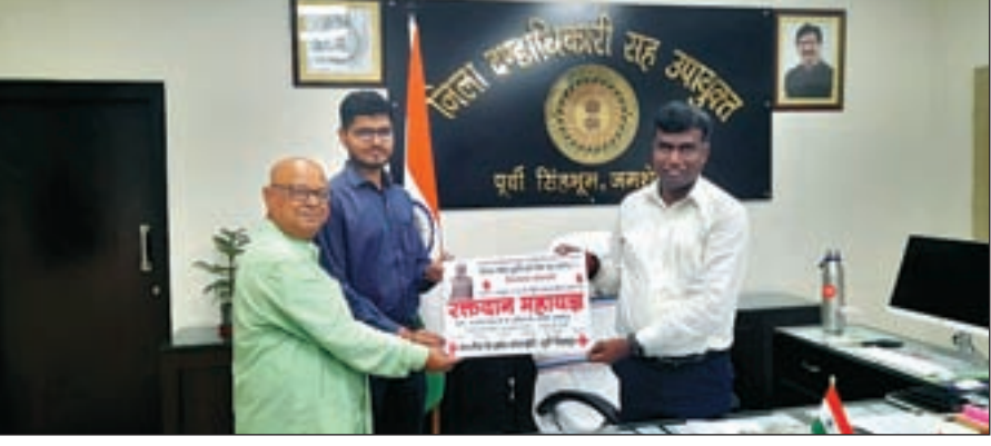
डोनेशन करवा रही है, जिससे जरूरतमंद लोगों को रक्त की आवश्यक मात्रा उपलब्ध हो पा रही है। इस क्रम में रेड क्रॉस सोसाईटी, पूर्वी सिंहभूम द्वारा राष्ट्रीय स्वैच्छक रक्तदान दिवस 1 अक्टूबर को एक वृहत रक्तदान शिविर का आयोजन रेड क्रॉस भवन, साकची में करने का निर्णय लिया गया है, जिसके लिए आज