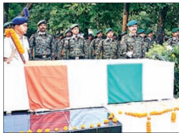
करने की शक्ति देने की प्रार्थना की। माननीय मुख्यमंत्री श्री हेमन्त सोरेन ने कहा कि राज्य को नक्सल से मुक्त करने के लिए