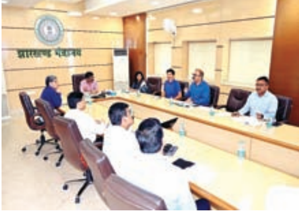
कार्यरत हो सके। संबंधित विभाग कंबाईड भवन का डीपीआर तैयार कर अग्रतर कार्रवाई करना सुनिश्चित करे। बैठक में मुख्यमंत्री श्री हेमन्त सोरेन ने पुलिस विभाग के अधिकारियों को निर्देशित किया

योजना बनाने की जरूरत है। मुख्यमंत्री ने कहा कि मानव तस्करी जैसे कार्यों में अनेक अपराधिक तत्व संगठित अपराध में लिप्त रहते हैं, ऐसे तत्वों की घर पकड़ के साथ-साथ आम जनता को भी इस दिशा में सजग और सावधान बनाने के लिए प्रभावी कदम उठाएं। मुख्यमंत्री हेमन्त सोरेन ने अधिकारियों को निर्देशित किया कि झारखंड के चौबोसों जिलों में एक कंबाईड बिल्डिंग बनायी जाए जहां एसटी/एससी थाना, एंटी ह्यूमन ट्रेफिकिंग थाना, साइबर थाना एवं महिला थाना 24x7