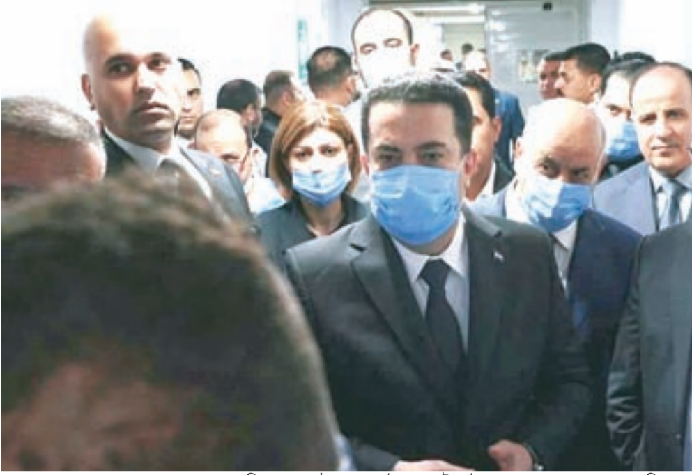
গুরুতরভাবে আঙ্গুনে পুড়ে গেছেন। বিয়ের অনুষ্ঠান হোটেল, রেস্টুরেন্ট এবং অন্যান্য স্থানগুলোর নিরাপত্তা রাখতে সেই ভেন্যুর মালিকদের বিরুদ্ধে নিরাপত্তা নীতিমালা লঙ্ঘনের অভিযোগ আনা হয়েছে। মসুল পৌরসভা বুধবার আহান জানিয়েছে যে যেসব

মসুল (ওয়েবডেস্ক): ইরাকের প্রধানমন্ত্রী দেশটির উত্তরাঞ্চলে একটি বিয়ের অনুষ্ঠানে ভয়াবহ অগ্নিকাণ্ডে প্রায় ১০০ জন নিহত হওয়ার কয়েক দিন পর বৃহস্পতিবার আহত রোগী ও নিহতদের পরিবারের সঙ্গে দেখা করেছেন। রাষ্ট্রীয় টেলিভিশনের রিপোর্টে বলা হয়েছে, মোহাম্মদ শিয়া আল-সুদানি বৃহস্পতিবার ভোরে মন্ত্রী ও নিরাপত্তা কর্মকর্তাদের একটি প্রতিনিধি দলসহ নিনভেহ প্রদেশে পৌঁছান। তিনি হামদানিয়া এবং আল-জুমহুরি হাসপাতালে আহত ও নিহতদের পরিবারের সদস্যদের সঙ্গে সাক্ষাৎ করেন। পরে তিনি সিরিয়ক ক্যাথলিক মার বেহনাম মনাত্তি (মঠ) পরিদর্শন করেন এবং ঘটনার শিকার ব্যক্তিদের প্রতি সমবেদনা জানান। মঙ্গলবার রাতে মসুলের কাছে হামদানিয়ায় একটি খুস্টান অধ্যুষিত এলাকার হাইথাম রয়্যাল ওয়েডিং হলের সিলিঙে পাইরোটেকনিক মেশিনে আগুন লাগার পর আতঙ্কিত প্রায় ২৫০ জন অতিথি জরুরী দরজার দিকে ভিড় করেন। এক স্বাস্থ্য কর্মকর্তা বার্তা সংস্থা এপিকে বৃহস্পতিবার জানিয়েছেন যে গুরুতরভাবে দক্ষ দুই ব্যক্তি হাসপাতালে চিকিৎসায়ী অবস্থায় মারা যান। তাদের একজন ৩০ বছর বয়সের এক নারী ও চার বছর বয়সী এক শিশু। কর্তৃপক্ষ জানিয়েছে, ঐ ঘটনায় প্রায় ১০০ জন নিহত হয়েছে আর মৃতের সংখ্যা আরও বাড়তে পারে এবং আরও অন্তত ১০০ জন আহত হয়েছেন যাদের অনেকেই