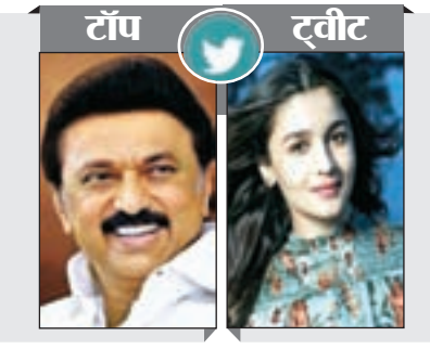
आलिया भट्ट बाँलिवुड अभिनेत्री

“पूर्व प्रधानमंत्री डॉ. मनमोहन सिंह को जन्मदिन की बधाई! प्रधानमंत्री के रूप में, वैश्विक वित्तीय संकट के दौरान उनके नेतृत्व और जवाबदारी नीतियों के प्रति प्रतिबद्धता ने भारत के अर्थव्यवस्था को नया आकार दिया। उनका संयोजित, बाँझक और विनम्र दृष्टिकोण एक उल्लेखनीय रूप में कार्य करता है, जो हर युग में नेतृत्व के लिए मूल्यवान सबक प्रदान करता है।”