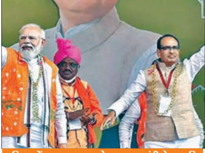
महिलाओं का आह्वान करते हुए प्रधानमंत्री ने कहा कि

महिलाओं को खास तौर पर कहा कांग्रेस को उसके नेता नहीं चला रहे खट्टे मन से महिला आरक्षण का समर्थन