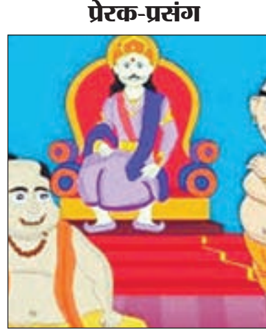
महाराज कृष्णदेव राय तेनालीराम से पूछते हैं कि उन्होंने उन सिक्कों का

अब गतांक से आगे .... हाराज कृष्णदेव राय भी तेनालीराम से उसका वादा निभाने को कहते हैं। उसके जवाब में तेनालीराम कहते हैं कि जब हमारी पृथ्वी पर फल, फूल, पेड़, पौधे, अनंत प्रकार के पशु, पक्षी, और अद्भुत वातावरण और अलौकिक सौन्दर्य हैं। फिर स्वर्ग की कामना क्यों? जबकि स्वर्ग जैसी कोई जगह है भी इसका कोई प्रमाण नहीं है। महाराज कृष्णदेव राय को चतुर तेनालीराम की बात समझ आ जाती है और वो उनकी प्रसंशा करते हैं। बाकी मंत्री जलन के मारे महाराज को दस हजार सोने के सिक्कों की याद दिलाते हैं। तब