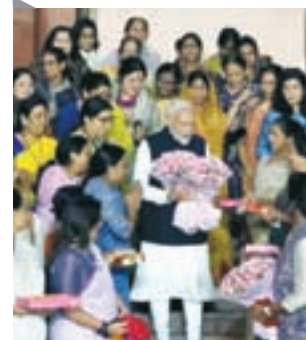
मुश्किल नहीं है। आप (सरकार) इसे अभी कर सकते हैं लेकिन इसे 2031 तक के लिए स्थगित कर दिया है। इसका क्या मतलब है? कांग्रेस प्रमुख मल्लिकार्जुन खड़गे ने कहा।

शकों की बाधाओं के बाद इतिहास रचते हुए महिला आरक्षण विधेयक आज शाम उच्च सदन से पारित हो गया। लोकसभा और राज्य विधानसभाओं में महिलाओं के लिए 33 प्रतिशत आरक्षण को औपचारिक बनाने के लिए अब राष्ट्रपति के हस्ताक्षर की जरूरत है। इस बिल को राज्यसभा से सर्वसम्मति से समर्थन मिला।