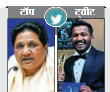
एटली दक्षिण भारतीय निर्देशक

इंस्टॉल करने के बाद आजमाना चाहिए। कॉन्टेक्ट पोस्टर और लाइव वॉइसमेल iOS 17 पर यूजर्स इंटरफेस की अधिकतर बातें 16 जैसी हैं। फोन ऐप में कॉन्टेक्ट पोस्टर के तौर पर बड़ा सुधार मिल रहा है। यह फीचर्स यूजर्स को अपना खुद का पोस्टर और एक प्रोफाइल फोटो सेट करने की सुविधा देता है, जिसे उनके कॉन्टेक्ट में अन्य लोगों के साथ साझा किया जाता है। इनमें पूरी लंबाई की इमेज या मेमोरी और बड़े टेक्स्ट के साथ कस्टमाइजेबल फॉन्ट शामिल हो सकते हैं। अस्सखी के अनुसार, कुछ क्षेत्रों में यूजर्स को लाइव वॉइसमेल के लिए रियल टाइम ट्रांसक्रिप्शन भी नजर आएगा जो कि डिवाइस पर प्रोसेस होता है। NameDrop A: SX AirDrop iOS 17 से कंपनी के वायरलेस शेयरिंग मैकेनिज्म AirDrop में सुधार होगा। आप किसी फाइल को शेयर करने, शेयरप्ले शेअर शुरू करने या एक साथ गेम खेलने के लिए बस दो डिवाइस को एक साथ ला सकते हैं।