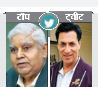
मधुर भंडारकर फिल्म निर्देशक

“इस अवॉर्ड को मैं पूरी टीम को मैं समर्पित करता हूँ। विदेशों में हमारी इंडियन फिल्में के कदम लगातार इजाजत हो रहा है। ऑस्कार में एशिया के कई मुलकों के लोग मिले खुशी हुई कि पाकिस्तान, अफगानिस्तान और मिल्डिल इस्ट के लोगों में इंडियन फिल्में को लेकर अलग क्रैज है।”