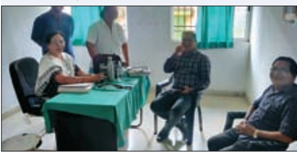
विधायक के प्रयास से पीएचसी में बैठ रहे चिकित्सक

विशेष मध्यस्थता अभियान 11 से 15 तक चलेगा रांची : व्यवहार न्यायालय, रांची में पांच दिवसीय विशेष मध्यस्थता अभियान जारी है। वादकारी 15.09.2023 तक मध्यस्थता केंद्र, रांची में आकर मध्यस्थता के माध्यम से वादों को सुलझा सकते हैं। विशेष मध्यस्थता अभियान में तलाक संबंधी मामले, वैवाहिक पुनर्स्थापना के मामले, दत्तक ग्रहण के मामले, भरण-पोषण के मामले, बच्चों के संरक्षकता एवं अभिरक्षा के मामले, परिवार न्यायालय में लंबित अन्य मामले, दहेज प्रतिषेध अधिनियम के मामले, भा0 20वि0 की धारा-498ए के मामले, घरेलू हिंसा के मामले, घरेलू हिंसा अधिनियम के अन्य मामलों का निस्तारण मध्यस्थों व अधिवक्ताओं के द्वारा किया जायेगा। उक्त तिथि को वादकारी उपस्थित होकर अपने वादों का निस्तारण करा सकते हैं। ज्ञात हो कि विशेष मध्यस्थता अभियान के अंतिम दिन कुल 12 (बारह) मामलों को सुलझाने में सफलता मिली और दोनों पक्ष राजी-खुशी से अपने मामलों को समाप्त करने के लिए तैयार हो गये। अन्य मामलों में अभी अंतिम स्तर की बातचीत बाकी है, इसलिए वे मामले विशेष मध्यस्थता के पास अगले स्तर की सुनवाई के लिए लंबित हैं। यह भी ज्ञात हो कि उक्त विशेष मध्यस्थता अभियान का आज समाप्त हो गया।