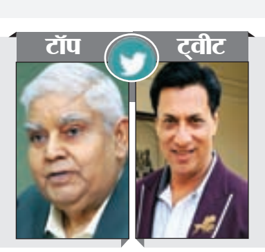
जगदीप धनखड़ उप राष्ट्रपति

“पिछले दस वर्षों के दौरान देश में सभी क्षेत्रों में व्यापक प्रगति हुई है। भारत विश्व की पांचवीं सबसे बड़ी अर्थव्यवस्था बन गया है और आने वाले समय में यह तीसरी बड़ी अर्थव्यवस्था बन जायेगा। उल्लेखनीय है कि विश्व की पंचम सबसे तेजी से बढ़ती अर्थव्यवस्था बन चुकी है।”