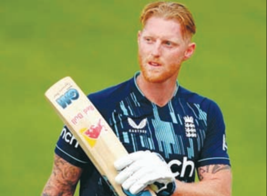
उधेड़ी और महज 124 गेंदों पर नौ छक्के एवं 15 चौकों की मदद से 182 रन की पारी खेली। वह 146 से ज्यादा की स्ट्राइक रेट से स्ट्राइक कर रहे थे। इससे पहले न्यूजीलैंड ने टॉस जीतकर इंग्लैंड को पहले बल्लेबाजी के लिए आमंत्रित किया और डेविड मलान 95 गेंदों में 96 रन (12 चौके और एक छक्का) के साथ तीसरे

एजेसियां लंदन : इंग्लैंड के धाकड़ ऑलराउंडर बेन स्टोक्स ने न्यूजीलैंड के खिलाफ तीसरे एक दिवसीय अंतरराष्ट्रीय मैच में अपनी धमाकेदार बल्लेबाजी से एक दिवसीय मैचों में 3,000 रन का आंकड़ा पार कर लिया है। अनुभवी ऑलराउंडर ने पिछले साल एकदिवसीय क्रिकेट से संन्यास का एलान कर दिया था, लेकिन हाल ही में अंतराष्ट्रीय क्रिकेट काउंसिल (आईसीसी) क्रिकेट विश्व कप में अपनी टीम की मदद करने के लिए उन्होंने एकदिवसीय के लिए फिर से वापसी की है। मैच के दौरान स्टोक्स ने बल्लेबाजों की जमकर बखिया