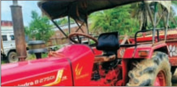
राष्ट्रीय खबर :::03