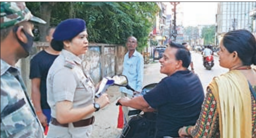
हेलमेट पहनने की अपील कर रहे हैं। हेलमेट चेकिंग अभियान का

हेलमेट सिर को हाइसे के साथ ही चेहरे को भी प्रदूषण से बचाता है