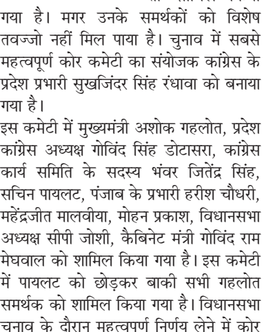
रमेश सर्राफ धमोरा स्वतंत्र-पत्रकार

राजस्थान विधानसभा के चुनाव होने में अब मात्र दो माह का समय रह गया है। मुख्यमंत्री अशोक गहलोत अकेले चलने की राह पर चुनावी मैदान में उतर चुके हैं। उन्होंने पूरे चुनाव की कमान अपने हाथों में थाम कर चुनावी व्यूह रचना करने में जुट गये हैं।