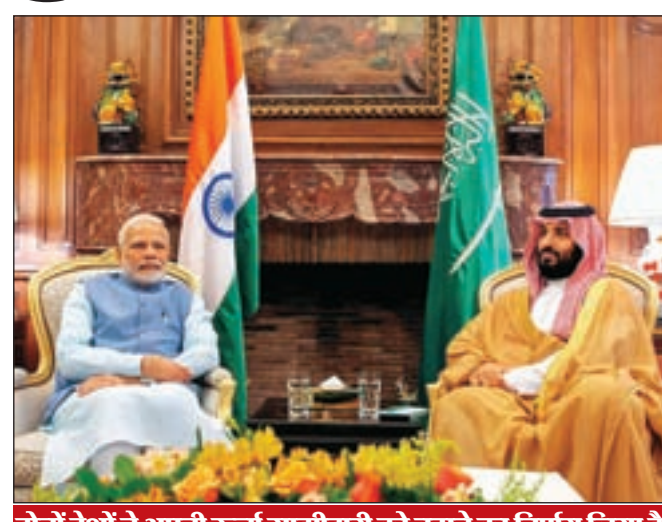
दोनों देशों ने अपनी ऊर्जा साझेदारी को बढ़ाने का निर्णय लिया है

भारत के लिए सऊदी अरब महत्वपूर्ण साझेदार: मोदी दोनों देश दुनिया से तेजी से बढ़ती अर्थव्यवस्था हैं आर्थिक कॉरिडोर का फैसला ऐतिहासिक फैसला