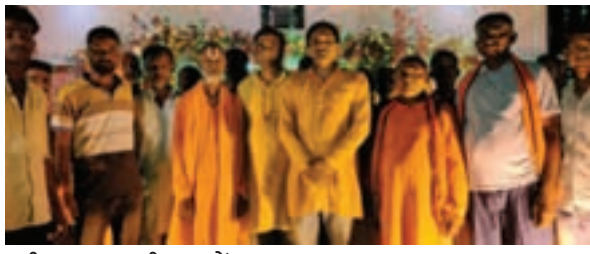
श्रीराम जानकी मठ में उमड़ा श्रद्धालुओं का मीड़, मठियम हुआ माहौल