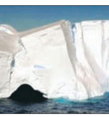
भीषण बाढ़ का प्रकोप है। इसके बीच ही समुद्री जलस्तर में उथलपुथल लाने की

मोटे बर्फखंड ढलान की राह पर हैं अभी तक सुधार के कोई संकेत नहीं बड़े ग्लेशियर उलट गये तो तबाही आयेगी