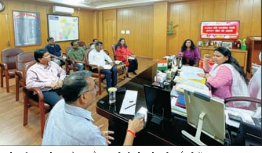
पदाधिकारी आपसी तालमेल बनाकर कार्यक्रम के सुगम संचालन के लिए केन्द्रित रहेंगे। आयोजन स्थल पर हर प्रकार की सुविधाओं मसलन पानी की पर्याप्त व्यवस्था, भोजन, अस्थाई शौचालय, निर्बाध बिजली आदि को चुस्त दुरुस्त रखने का निर्देश दिया। उन्होंने सभी नोडल पदाधिकारियों को कार्यक्रम की सफलता के लिए आपसी समन्वय के साथ सभी आवश्यक

हजारीबाग: उपायुक्त नैसी सहाय ने 11 सितंबर को प्रमंडलीय रोजगार मेला सह ऑफर लेटर वितरण समारोह के तैयारियों की शुक्रवार को समीक्षा की। उन्होंने संबंधित अधिकारियों के साथ बैठक की गई। बैठक में कार्यक्रम के सफल आयोजन के लिए हर प्रशासनिक बिंदुओं पर चर्चा की गई। उपायुक्त ने कहा की हजारीबाग प्रमंडल के सभी सात जिलों से बड़ी संख्या में लाभुक नियुक्ति पत्र लेने आयोजन स्थल पर आयेगे इसलिए सभी प्रतिनियुक्त