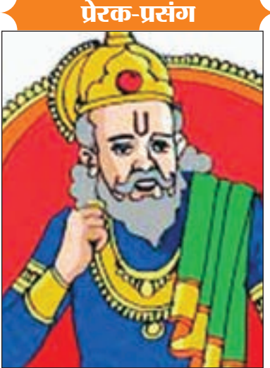
खोला, जब कर्मर के दरवाजा खुला तो अंदर कुछ भी नहीं था सिवाय एक फटे

हुए कपड़े के जो दीवाल की खुटी पे लटका था। मंत्री ने पूछा की महाराज यहा तो कुछ भी नहीं है। राजा ने उस फटे कपड़े को अपने हाथ में लेते हुए उदास स्वर में कहा कि यही तो है मेरा सबकुछ, जब भी मुझे थोड़ा सा भी अहंकार आता है, तो मैं यहाँ आकर इन कपड़ों को देख लिया करता हूँ। मुझे याद आ जाता है की जब मैं इस राज्य में आया था तो इस फटे कपड़े के अलावा मेरे पास कुछ भी नहीं था। तब मेरा मन शांत हो जाता है और मेरा घमण्ड समाप्त हो जाता है, तब मैं वापस बाहर आ जाता हूँ। सेनापति से रहा नहीं गया उसने हिम्मत करके राजा से पूछा की राजन, यदि आप क्षमा करें तो यह बताइये कि उस कर्मर में एसी कौन सी वस्तु है, जिसकी सुरक्षा की आपको इतनी कि फ्र है। ... समाप्त।